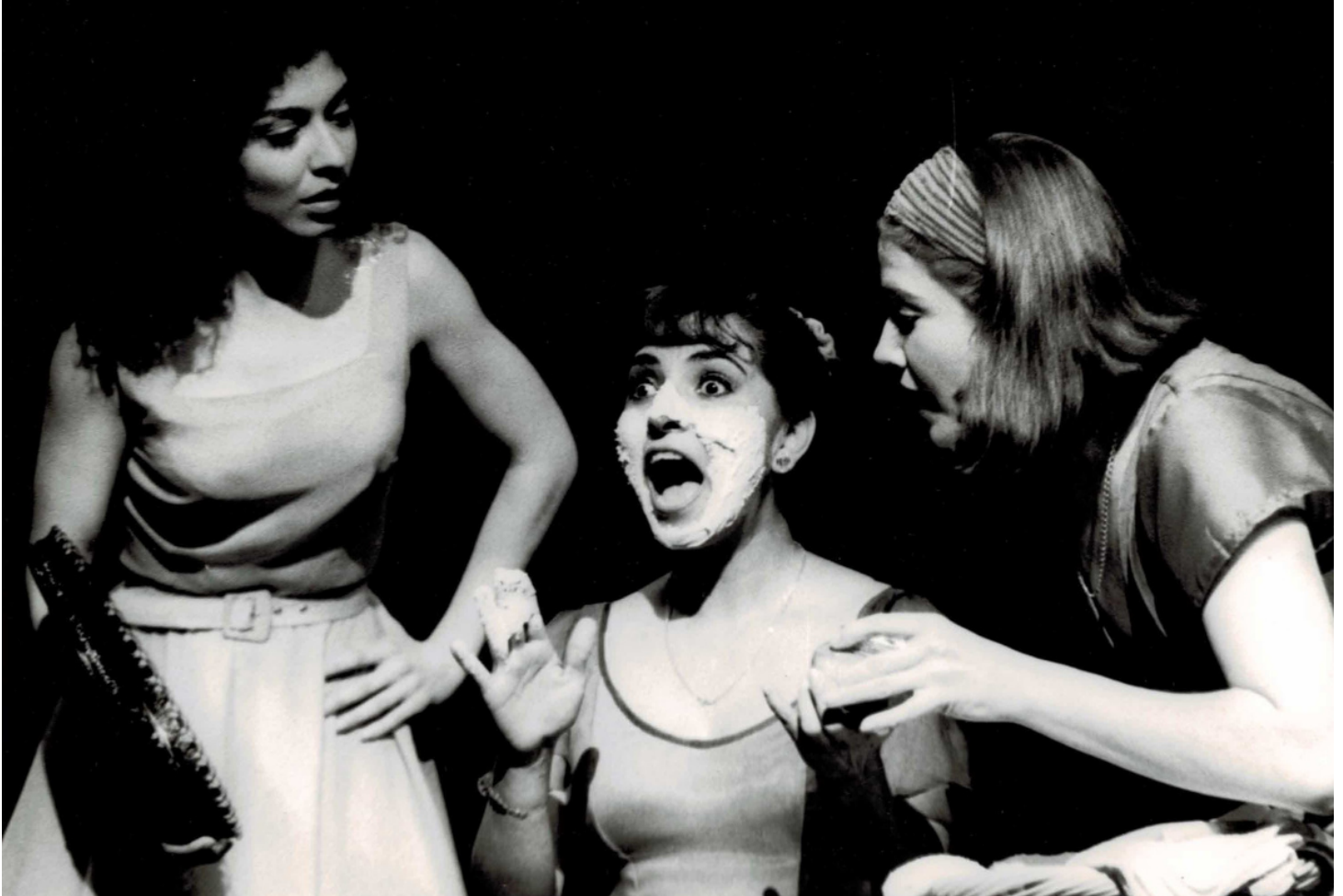
“Confesiones de mujeres de 30” Dirección Lía Jelín.

Cuando nos vamos, no nos llevamos nuestros éxitos o fracasos, nos llevamos el aprendizaje que nos dejó el caminar hacia ahí. Nos llevamos la maestría con la que sorteamos los obstáculos, y nuestro legado será la cualidad humana con la que compartimos ese tránsito.