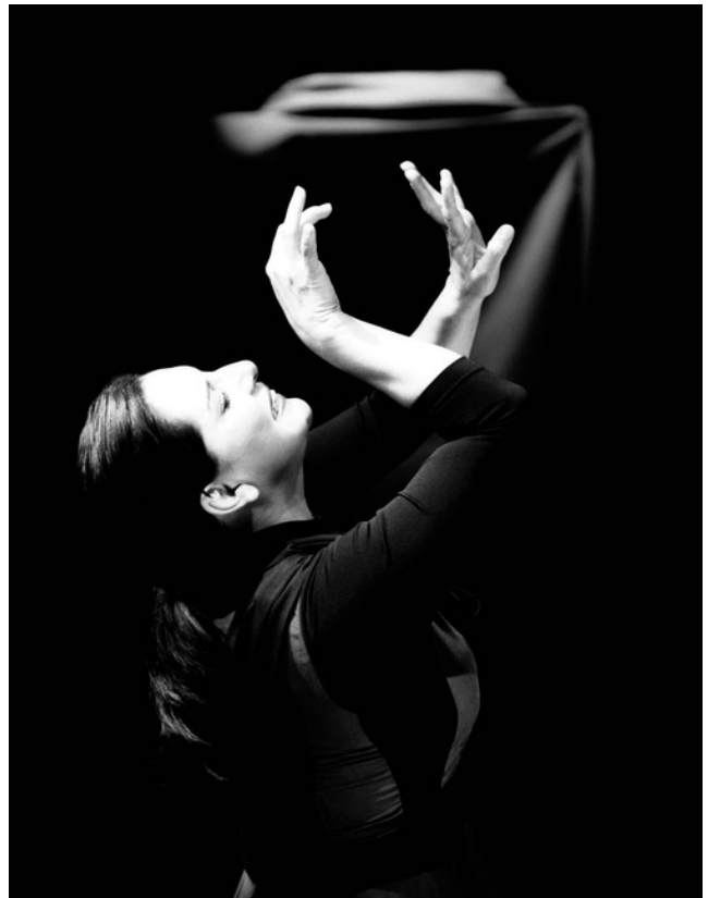
“Muerte en directo” de Guillermo Heras. Monólogo.