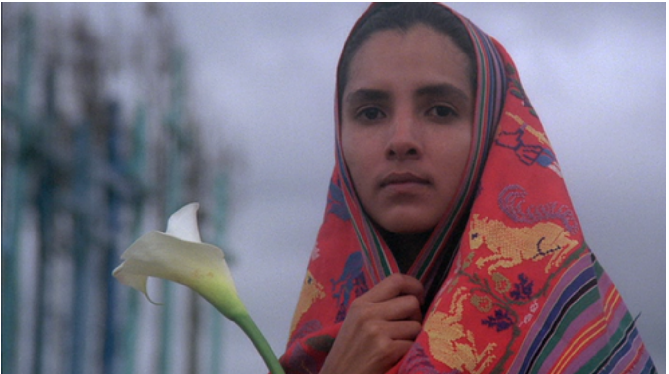
“El Norte” Película de Gregory Nava. Foto de producción.

Ha protagonizado y participado en series como Ellas son... la alegría del hogar, Madre solo hay dos, además de las películas: Que viva México y El hijo de su padre y las telenovelas Para volver amar, Que pobres tan ricos y La doble vida de Estela Carrillo, por ejemplo.