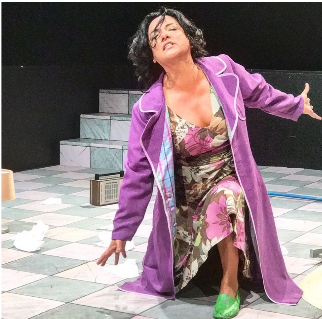
“Hasta la China fueron a dar mis mechass con el ventarrón” De Amos Oz.

En 1997 crea Mundo Canela junto con Richard McDowell, donde vierte el resultado de sus investigaciones.