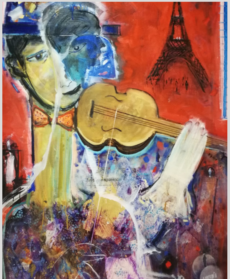
"Música en París". Oleo sobre lienzo. Autor: Conchi Ororbía.

Desde el 2012 fue premiada con el SEGUNDO PREMIO del tercer Concurso Cultural Europeo de Artes Plásticas de ACUARELA.