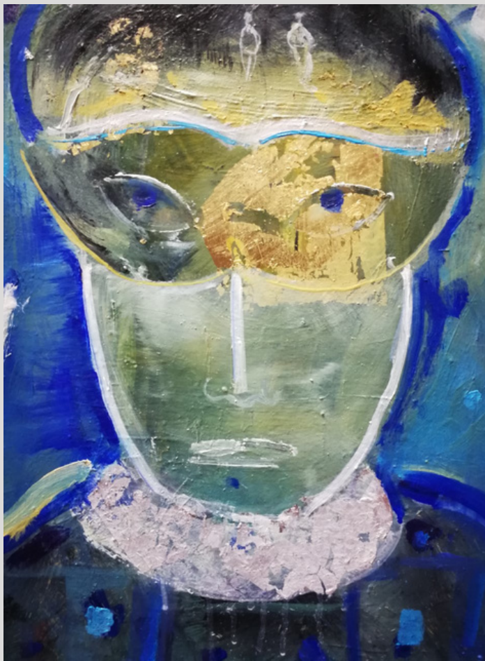
"Ironías" Oleo sobre lienzo. Autor: Conchi Ororbía.