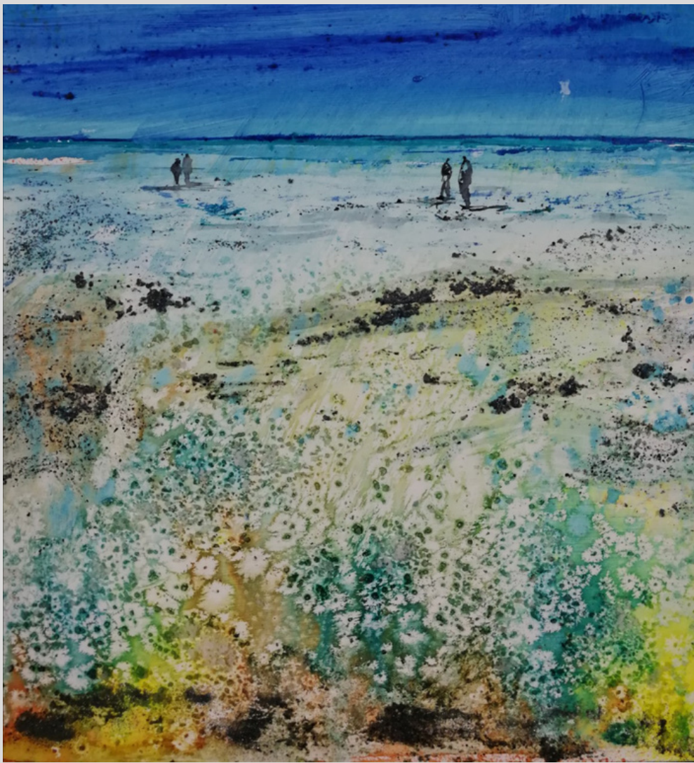
"Bajo la luna" 24 x 24. Conchi Ororbía.

El descubrimiento de la acuarela en el año 2012 ha resultado decisivo a la hora de expresar e interpretar un mundo imaginario e incluso escenas cotidianas de una manera libre y espontánea; unas veces con dibujo previo, grafismos, estudio de color y similares con objeto de sintetizar al máximo, otras enfrentándome al papel en blanco y dando rienda suelta al pincel, a los pigmentos, a las tintas, al spray, a los polvos de mármol y demás materiales, dejándome sorprender por las sensaciones únicas que constituyen parte del aprendizaje e investigación de esta técnica tan compleja como apasionada. Para ella, es ahí donde radica la magia de la acuarela, con la cual, una vez se inicia, uno no puede separarse.