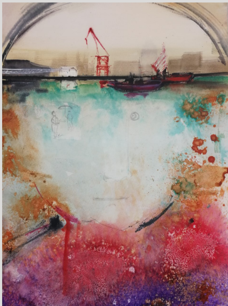
"Carola". 42 x 30 cms. Autor: Conchi Ororbía.

En el 2021 es seleccionada en MUNDART-PROYEC 2021 y FINALISTA concurso internacional "Entre Grises" de Windsor & Newton por Acuarelistas Avanzados. Fue FINALISTA concurso on-line de la Asociación de Acuarelistas de Majadahonda.