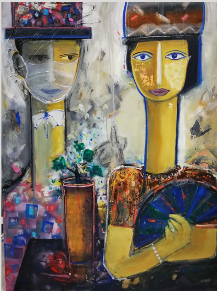
"Reencuentro". Oleo sobre lienzo. Autor: Conchi Ororbía.