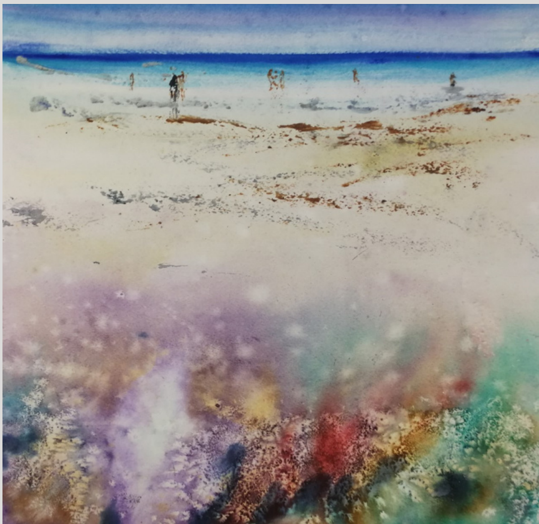
"Arena Blanca" 31 x 31. Conchi Ororbía.

Mis obras han sido expuestas en numerosas exposiciones tanto individuales como colectivas a lo largo de la península, destacando sus presentaciones en Madrid, Barcelona, Bilbao, Sevilla, Jerez, León, San Sebastián, Oviedo, Santiago de Compostela, Málaga, Ávila, Pamplona, etc. he participado con obras en certámenes internacionales en Europa (Portugal, Italia, París, Mónaco, Estocolmo, Mónaco, Ucrania, Kosovo, Balcanes, Lituania, Eslovenia y Suecia) en América (Perú, México y Estados UNIDOS) , en Indonesia y Asia ( Vietnam). He participado en importantes ferias de arte internacionales y nacionales.