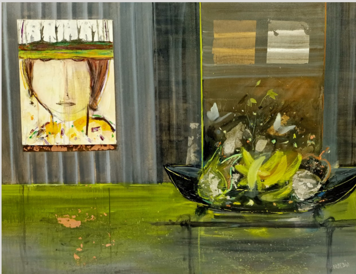
"Sueños de libertad" 130 x 97. Oleo sobre lienzo. Autor: Conchi Ororbía.

Las obras que presento para la revista pertenecen a la serie ENSOÑACIONES ONIRICAS creadas durante la pandemia.