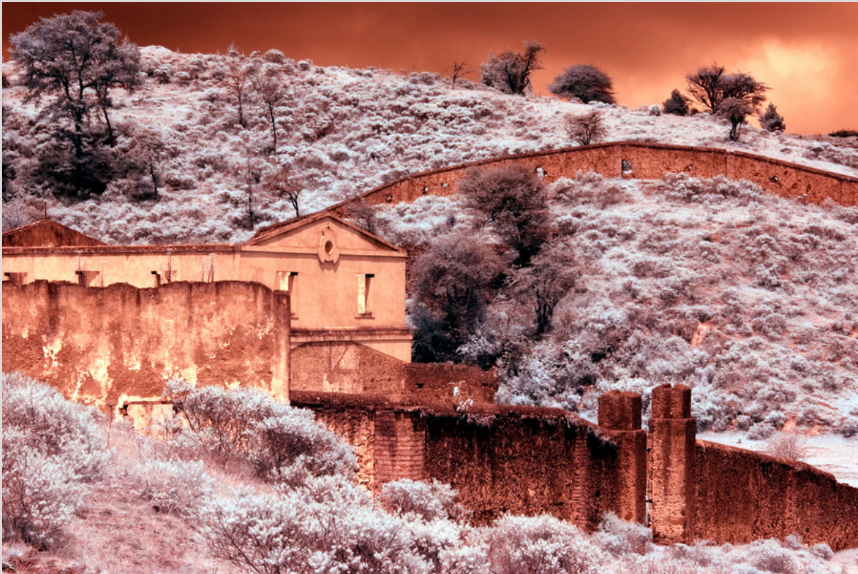
Sueños de una noche distópica. Autor Flor de Ma.Rico.

En su trabajo emplea técnicas antiguas como; cianotipia, van dyke, transferencia al carbón, goma bicromatada, paladio platino sin dejar de lado las nuevas tecnologías.