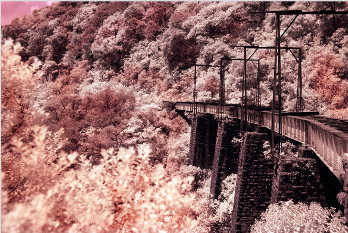
Sueños de una noche distópica. Autor Flor de Ma.Rico.

En su trabajo emplea técnicas antiguas como; cianotipia, van dyke, transferencia al carbón, goma bicromatada, paladio platino sin dejar de lado las nuevas tecnologías.