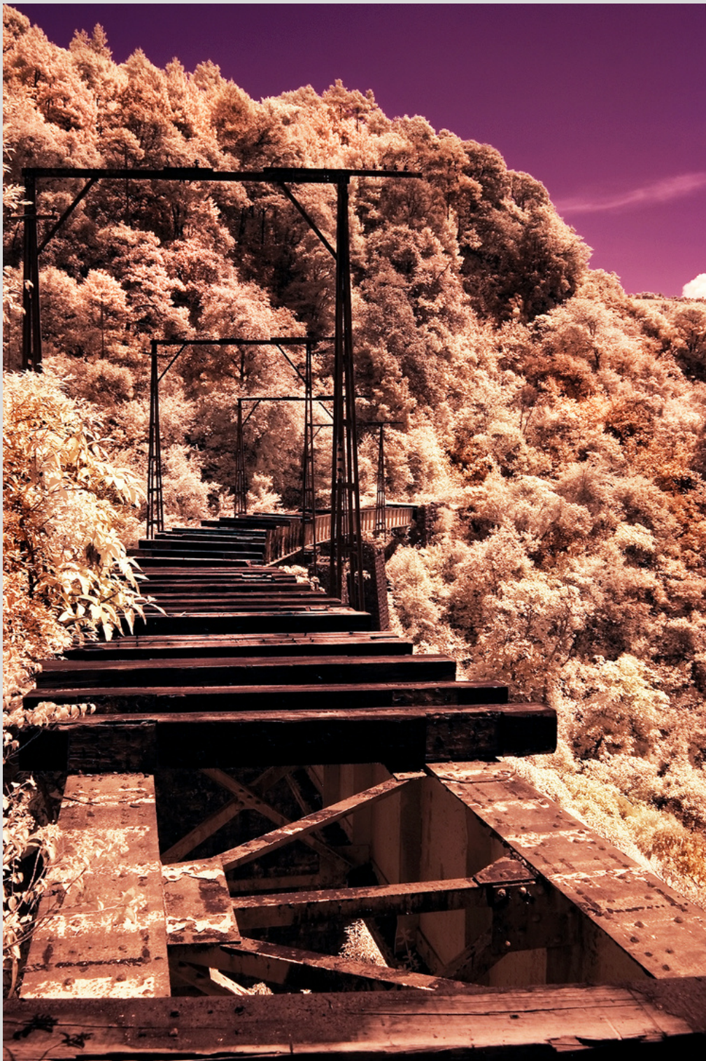
Sueños de una noche distópica. Autor Flor de Ma.Rico.

Ha obtenido la Beca Estatal Jóvenes Creadores otorgada por el FOESCAP en 1994 y 1998.