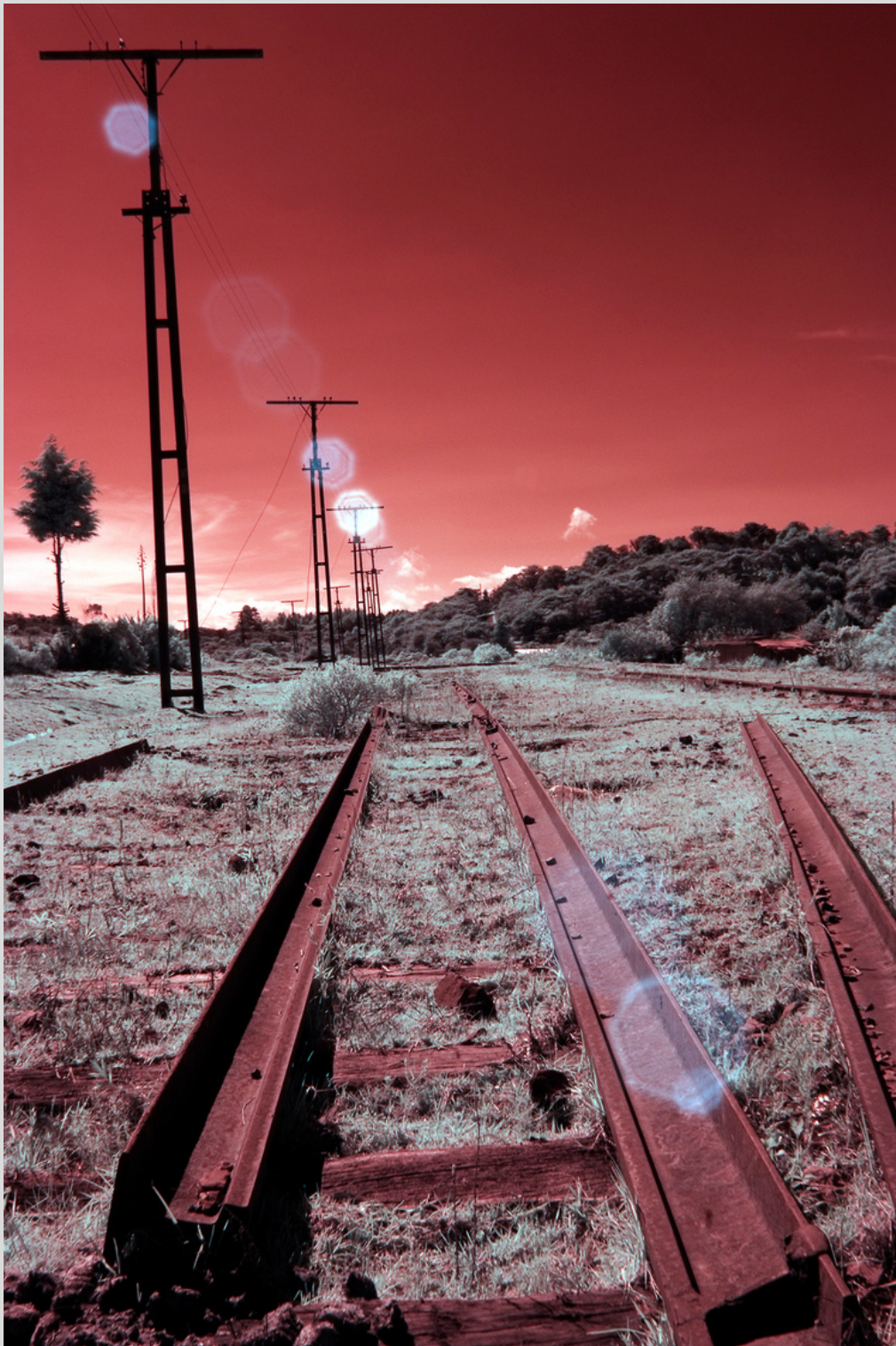
Sueños de una noche distópica. Autor Flor de Ma.Rico.

Ha expuesto en el Museo de Arte Religioso en Santa Mónica, Museo de Arte San Pedro, Casa de la Cultura de Monterrey, Museo Nacional de los Ferrocarriles Mexicanos, Galería de Arte Contemporáneo, Galería del Centro Cultural Universitario de la Universidad Autónoma del Estado de Morelos entre otros.