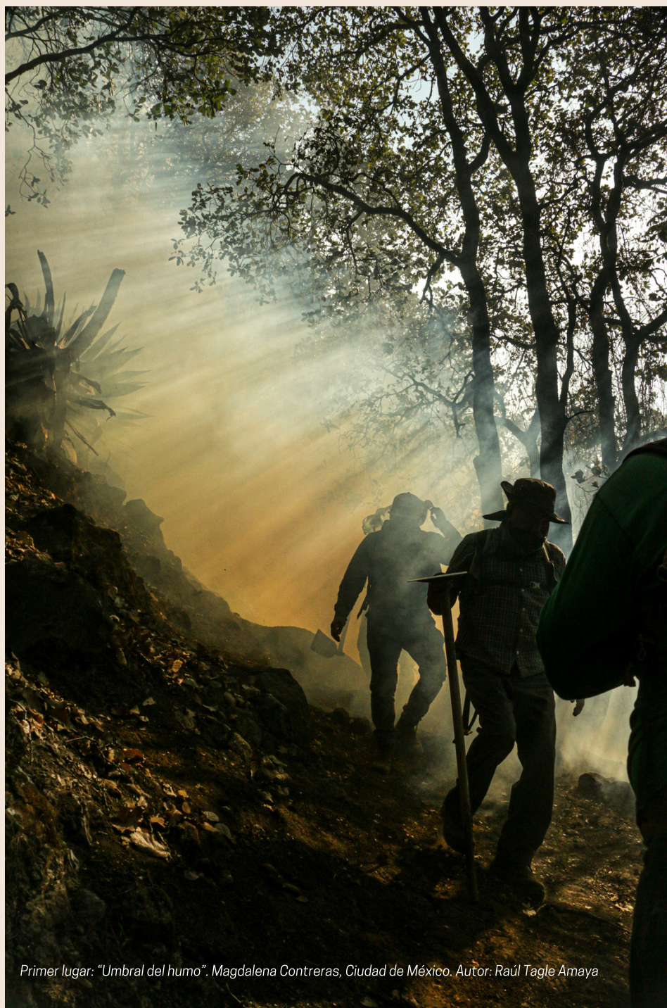
Primer lugar: "Umbral del humo". Magdalena Contreras, Ciudad de México. Autor: Raúl Tagle Amaya

Mención honorífica: "El avance del fuego". Guadalcázar, San Luis Potosí. Autora: Marcela Urmenta Gil.