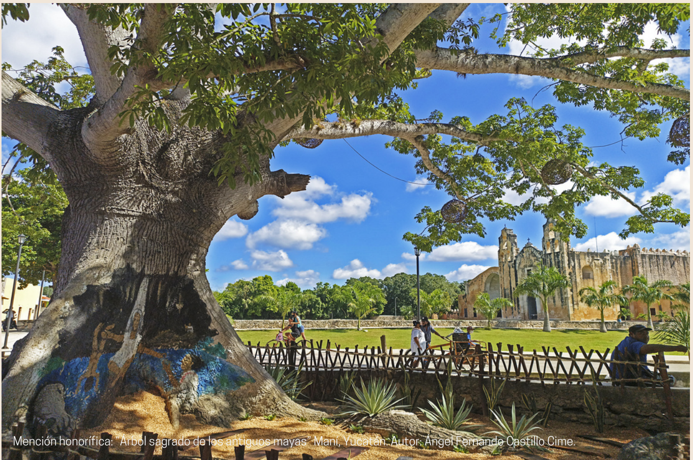
Mención honorífica: "Árbol sagrado de los antiguos mayas" Mani, Yucatán. Autor: Ángel Fernando Castillo Cime.