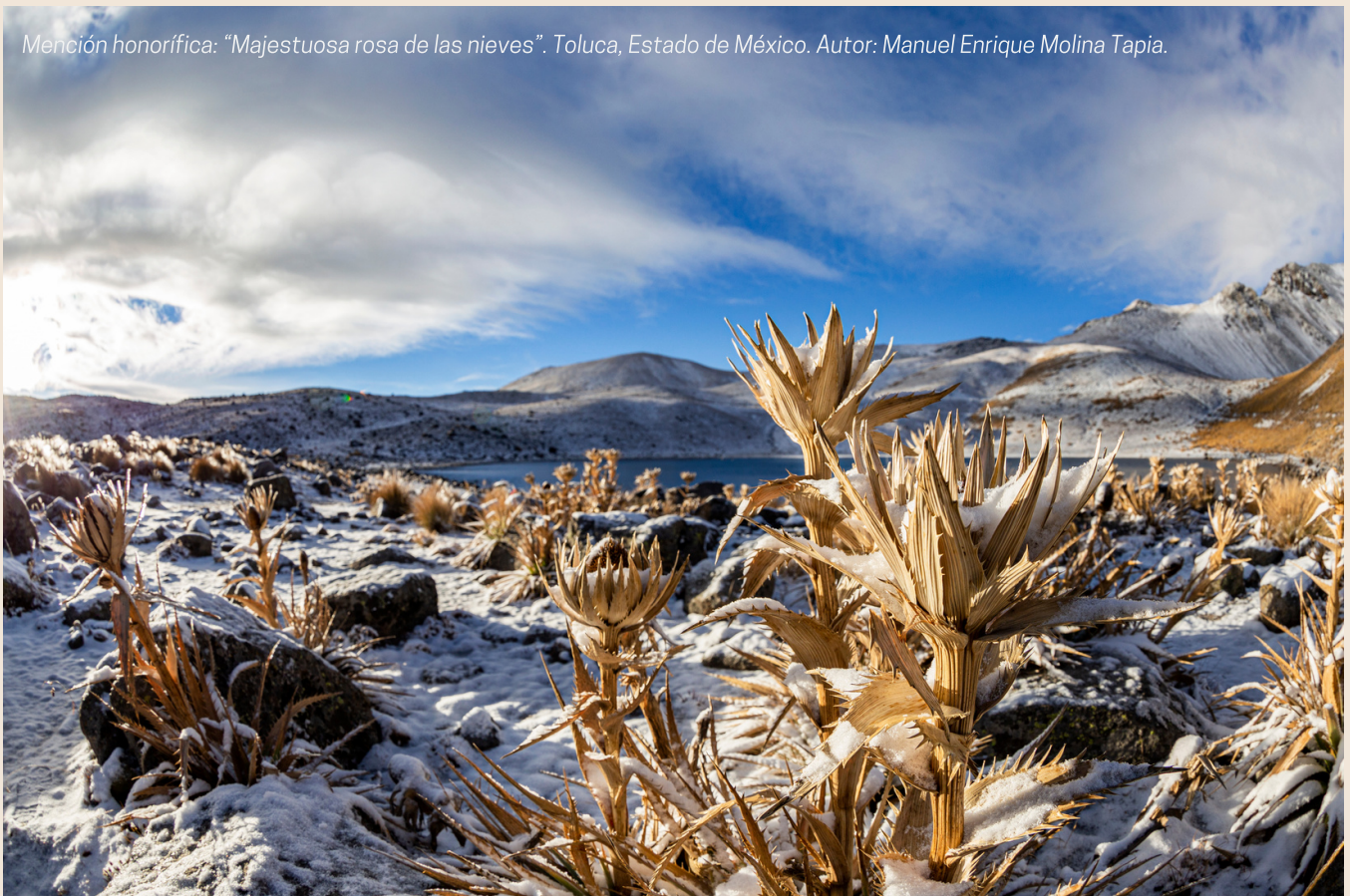
Mención honorífica: "Majestuosa rosa de las nieves". Toluca, Estado de México. Autor: Manuel Enrique Molina Tapia.