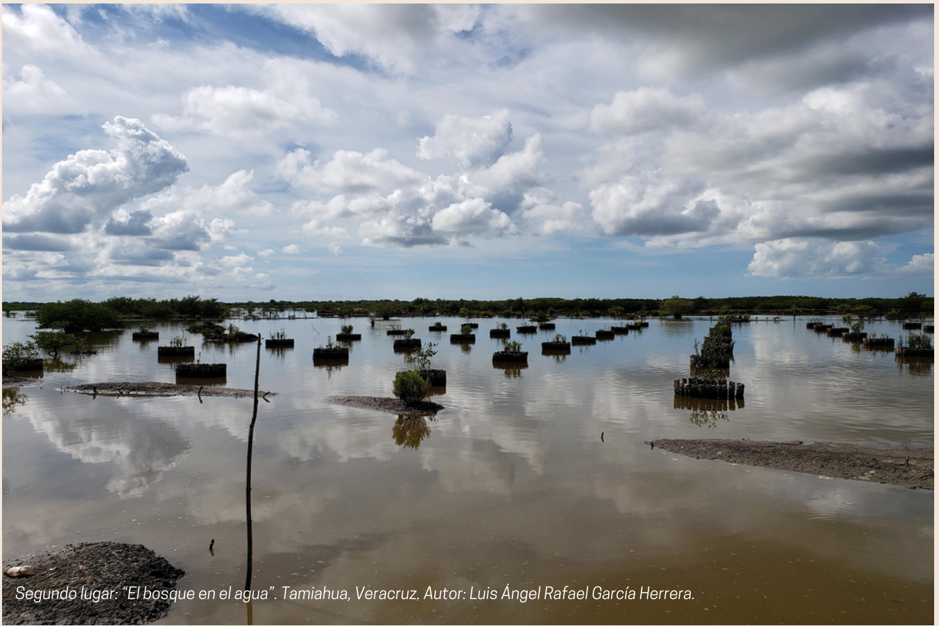
Segundo lugar: "El bosque en el agua". Tamiahua, Veracruz. Autor: Luis Ángel Rafael García Herrera.