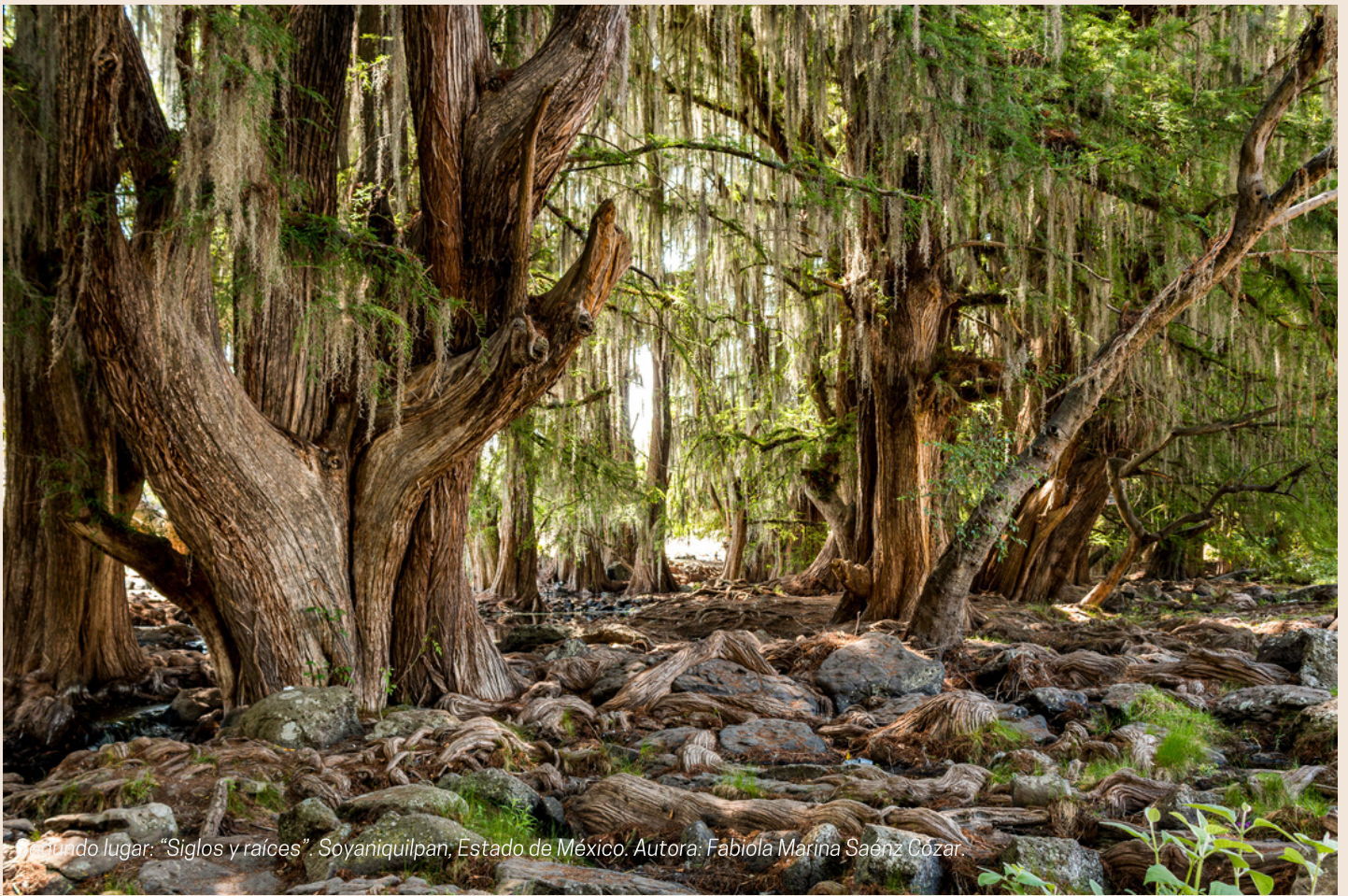
Mencionado lugar: "Siglos y raíces", Soyaniquilpan, Estado de México. Autora: Fabiola Marina Saenz Cózar.