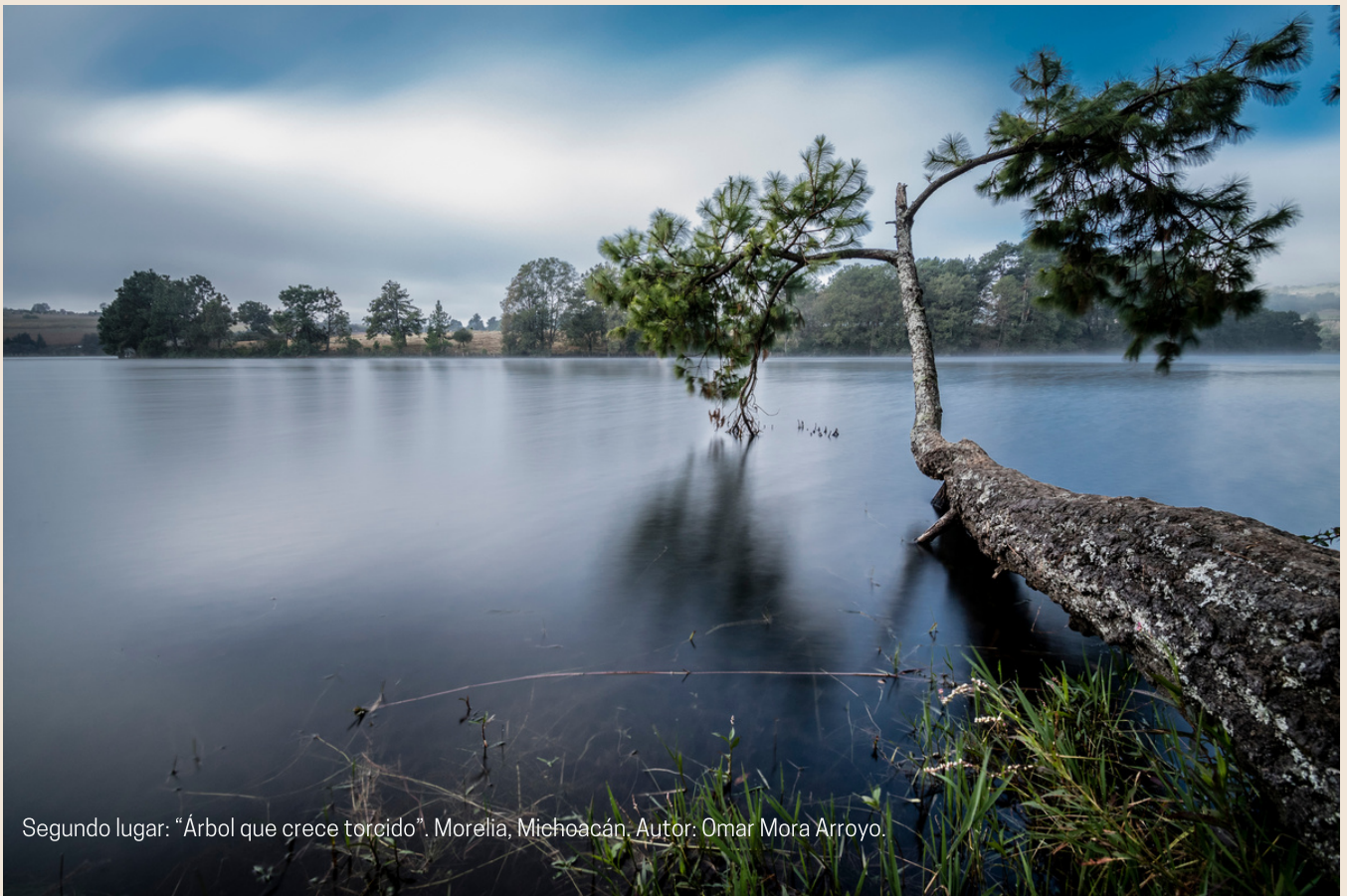
Segundo lugar: "Árbol que crece torcido". Morelia, Michoacán. Autor: Omar Mora Arroyo.