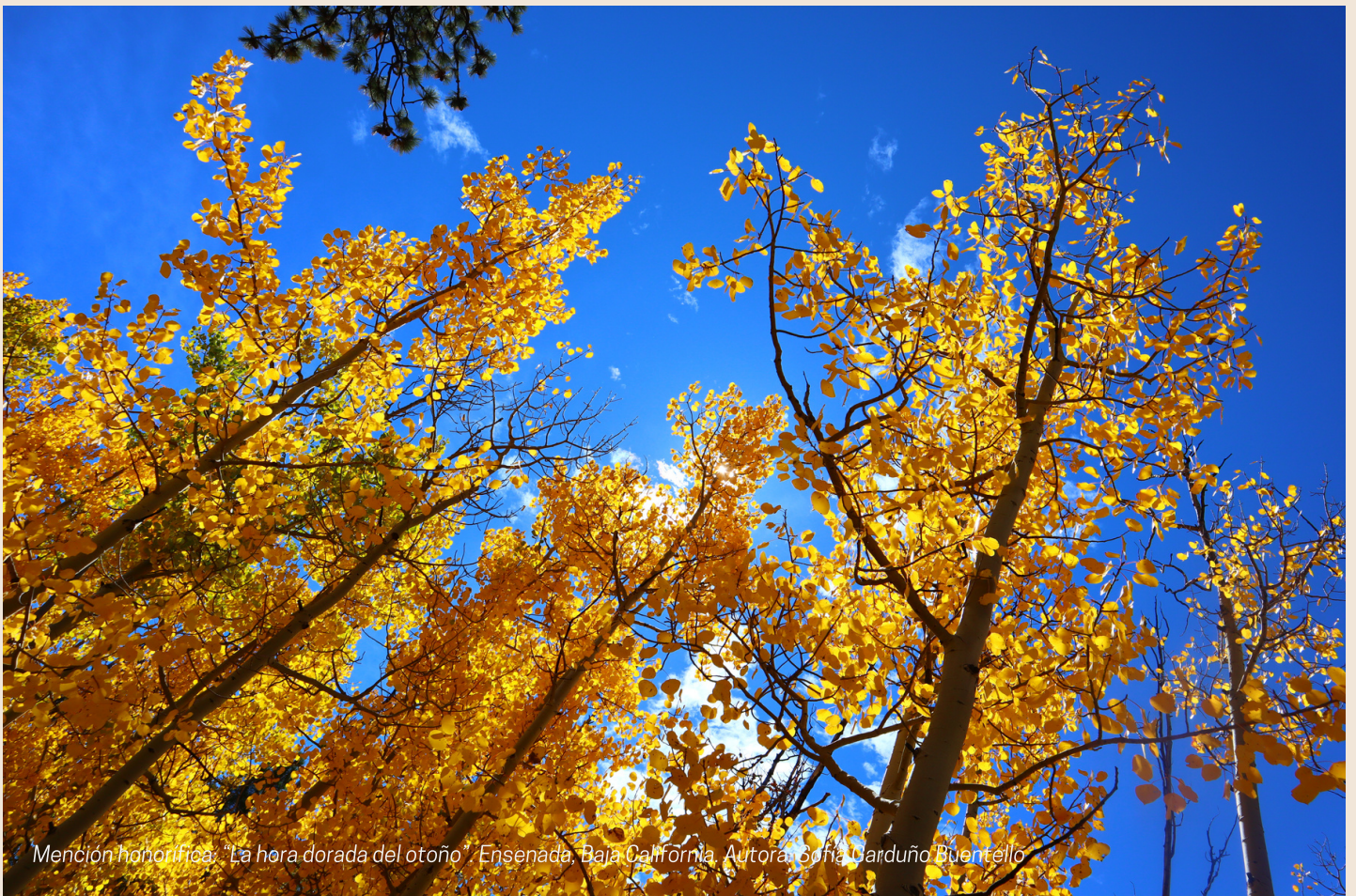
Mención honorífica: "La hora dorada del otoño", Ensenada, Baja California. Autora: Sofía Garduño Buentello.