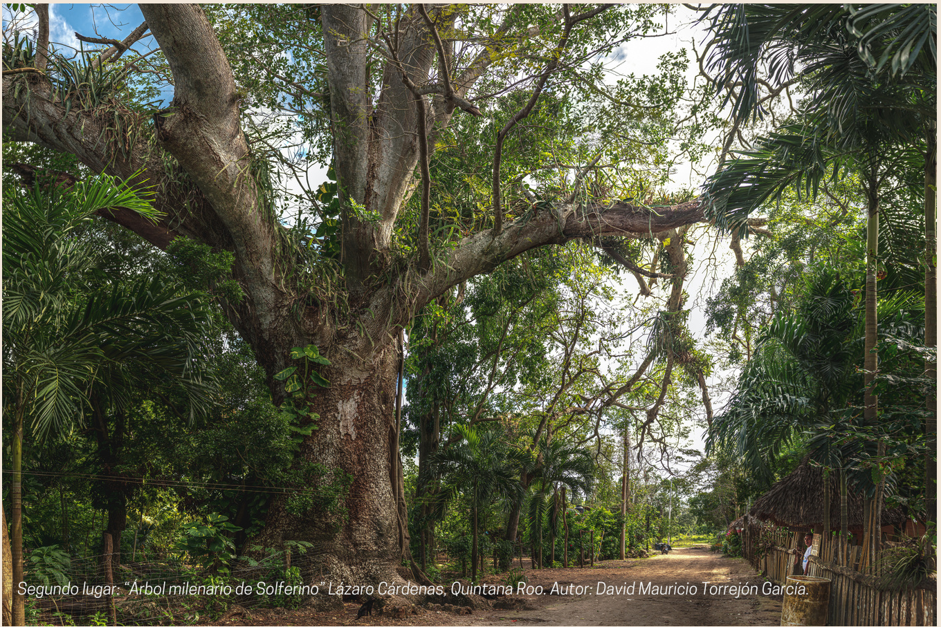
Segundo lugar: "Árbol milenario de Solferino" Lázaro Cárdenas, Quintana Roo. Autor: David Mauricio Torrejón García.