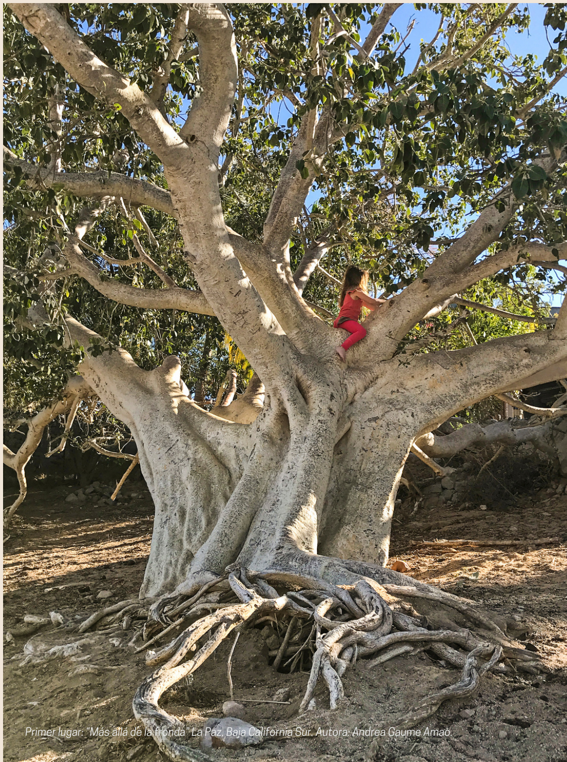
Primer lugar: "Más allá de la fronda" La Paz, Baja California Sur. Autora: Andrea Gaume Amao.

Mención honorífica: "Árbol sagrado de los antiguos mayas" Maní, Yucatán. Autor: Ángel Fernando Castillo Cime.