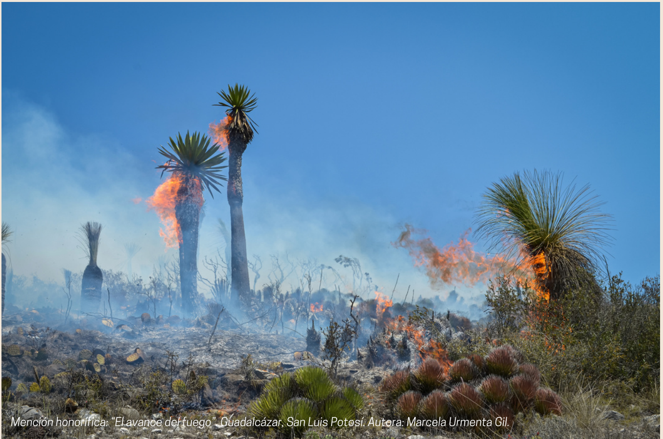
Mención honorífica: "El avance del fuego". Guadalcázar, San Luis Potosí. Autora: Marcela Urmenta Gil.