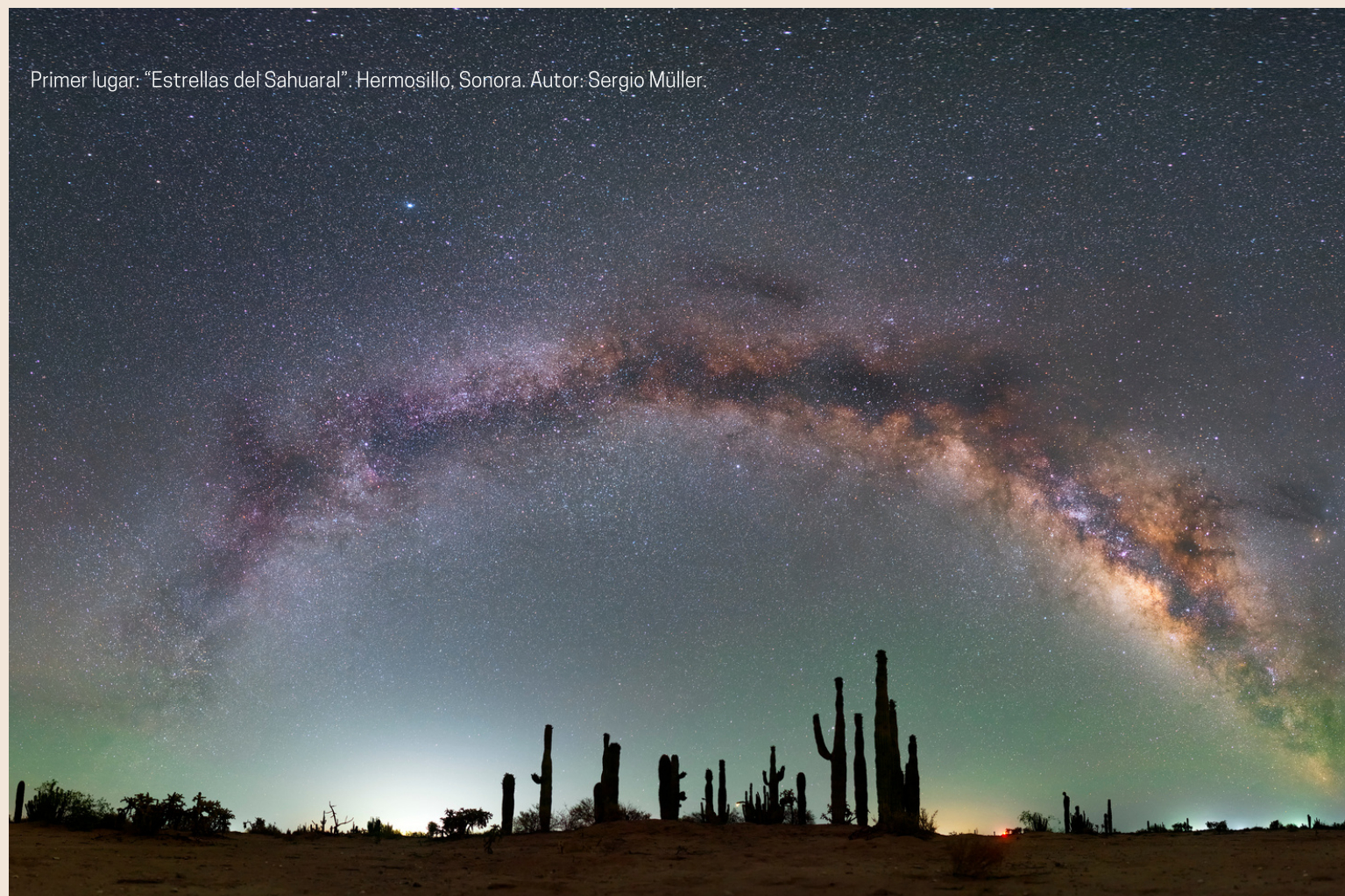
Primer lugar: “Estrellas del Sahuaral”. Hermosillo, Sonora. Autor: Sergio Müller.

Mención honorífica: “Majestuosa rosa de las nieves”. Toluca, Estado de México. Autor: Manuel Enrique Molina Tapia.