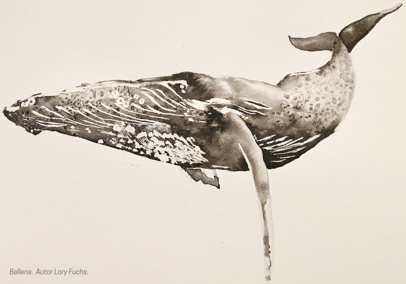
Ballena. Autor Lory Fuchs.

Lo que nos lleva al otro lado del arcoiris. La vida dio tantas vueltas para Lory que insoslayablemente volvió a su primer amor: la pintura. Encontró en la acuarela un medio lúdico para plasmar su visión del mundo: ballenas que nadan en el cielo estrellado, corazones con piel de cactus, plantas que estallan de color, y todo un mundo expresivo que sigue en expansión. Si su poesía es una cruda y despiadada imagen de un lugar de su alma, en sus pinturas encontramos la luz que ella ve en el mundo. Ellas se pueden adquirir en su página web: loryfuchs.com , y en varias plataformas nacionales e internacionales de arte y decoración.