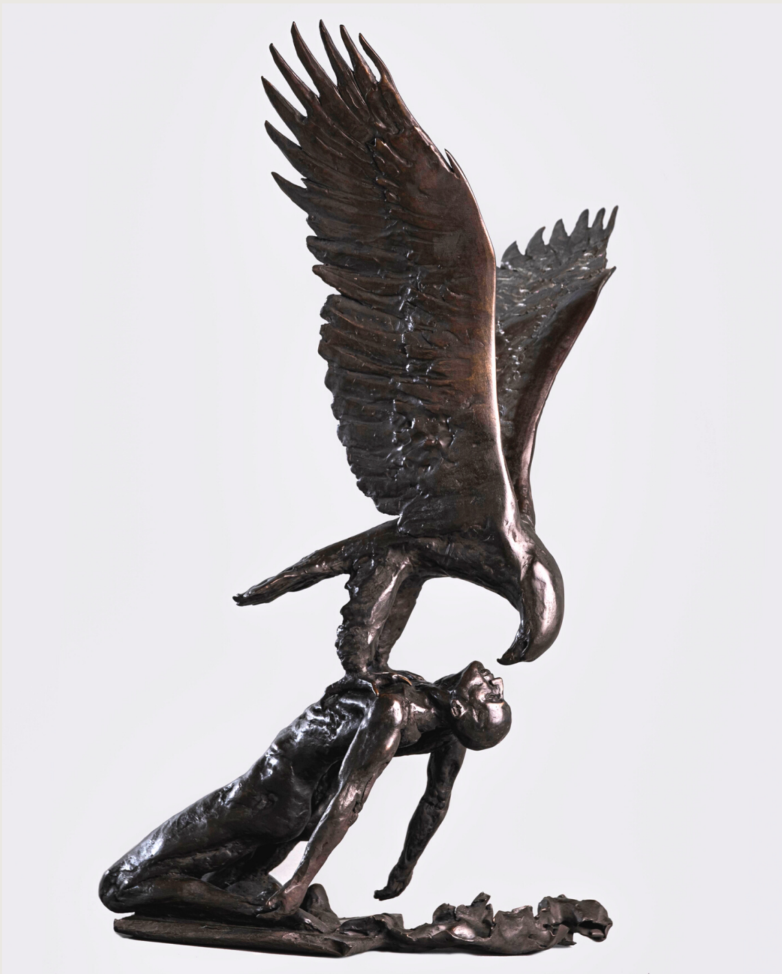
Renacimiento. Bronce 68 x 46 x 34 cms. Autor: Francisco Armas Padrón.

Francisco Armas es un reconocido artista a nivel nacional e internacional, tal y como se comprueba a lo largo de su carrera, con la exitosa participación en exposiciones individuales y colectivas, así como en numerosos concursos. En 2016 participa en varias exposiciones colectivas en salas de Tenerife, destacando el “V Evento de arte internacional Creative Art Awards TEN-DIEZ, consiguiendo el PRIMER PREMIO de entre los 34 artistas finalistas.