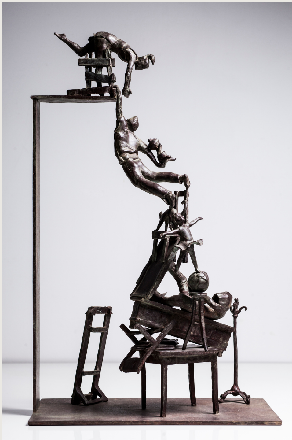
Donde estés y como sea llego a tí. Bronce 65 x 40 x 25 cms. Autor: Francisco Armas Padrón.

Diseño y realización de los trofeos del concurso internacional Open Fotosub, El Hierro 2019 en adelante.