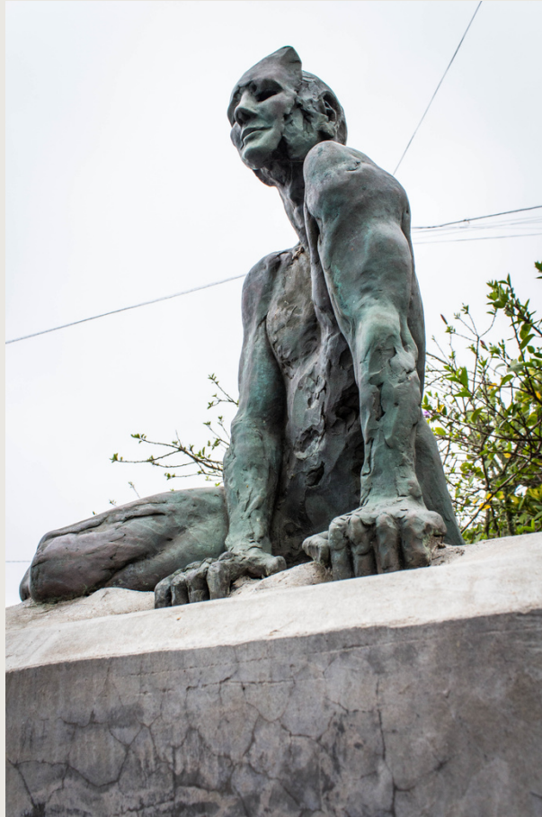
Máscara. Bronce 80 x 50 x 38 cms. Autor: Francisco Armas Padrón.

El bronce es el material ideal para contar lo que quiero transmitir, ya que puedo conjugar e integrar la figuración y la abstracción, lo orgánico y lo geométrico, sin que dejen de formar un todo. Me interesa, y el bronce me permite, plasmar el dinamismo, el desequilibrio y cierta inestabilidad en las formas.