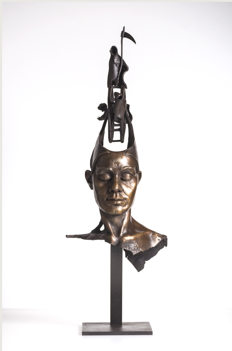
Serenidad. Bronce 66 x 21 x 18 cms. Autor: Francisco Armas Padrón.

Modelo directamente en cera, lo que permite conseguir formas y texturas que no posibilita la arcilla. De modo que ese proceso me obliga a tener como objetivo principal la línea o la estructura general de la escultura sin detenerme en detalles que podrían resultar superfluos.