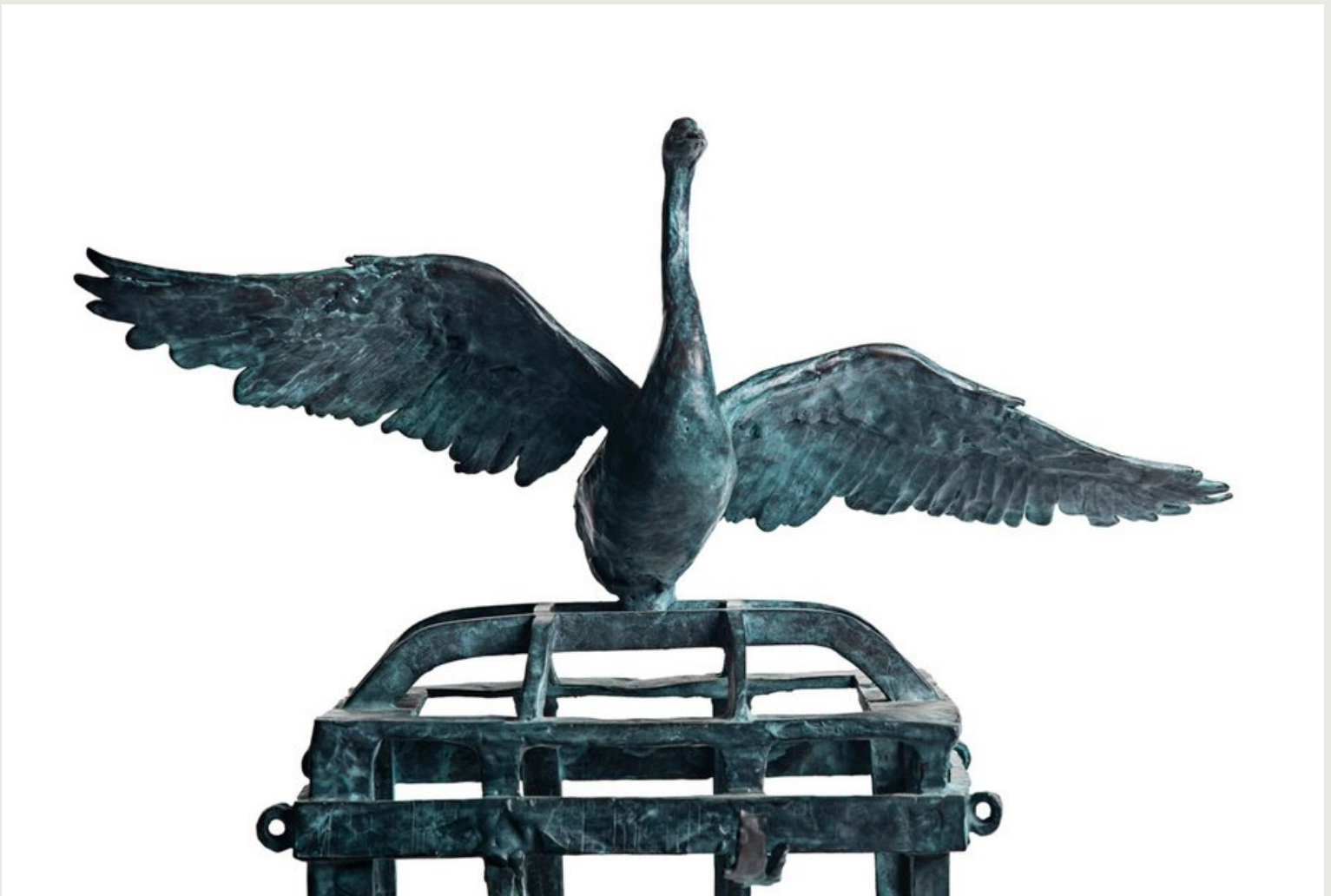
Espíritu libre. Bronce 2018 Autor: Francisco Armas Padrón.

Al terminar la facultad y los estudios de Bellas Artes realizo algunas exposiciones.