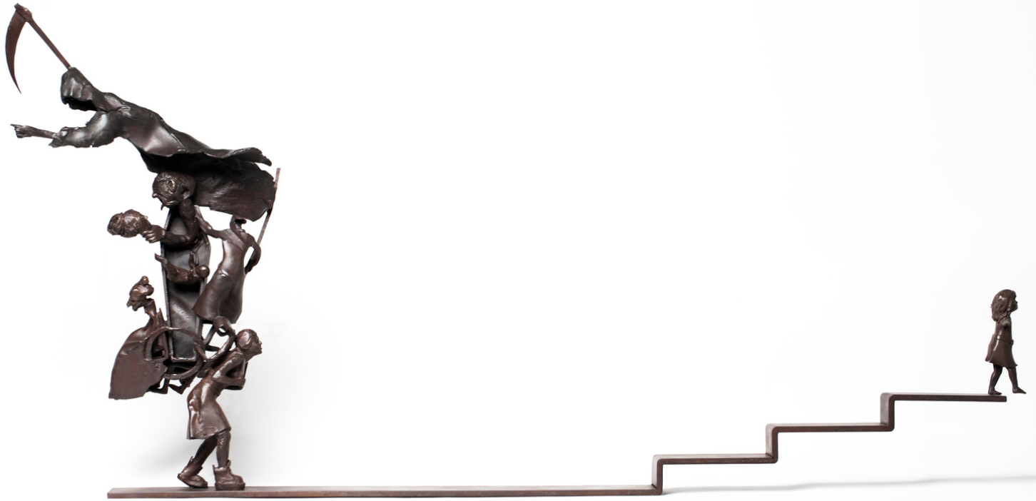
El camino. Bronce 47 x 85 x 15 cms. Autor: Francisco Armas Padrón.

A partir de 2003 detiene su producción artística y se dedica profesionalmente a su taller de enmarcación, donde también imparte clases de dibujo y pintura y realiza retratos por encargo.