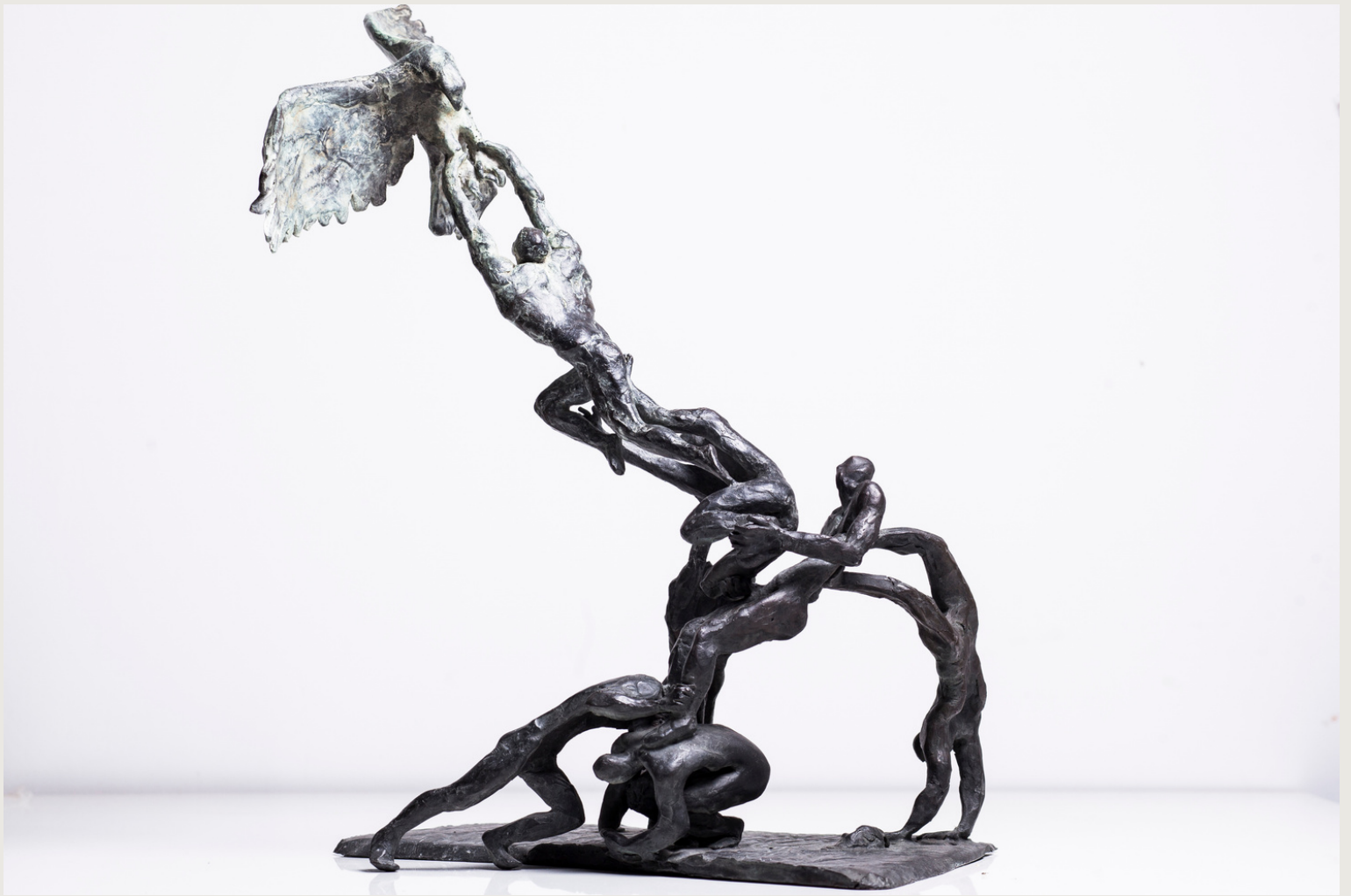
Todos somos uno. Bronce 45 x 36 x 27 cms. Autor: Francisco Armas Padrón.

Obra seleccionada para la exposición bianual Figurativas painting & Sculpture Competition 2019 y 2021. Organizada por el Museo Europeo de Arte Moderno MEAM, Barcelona.