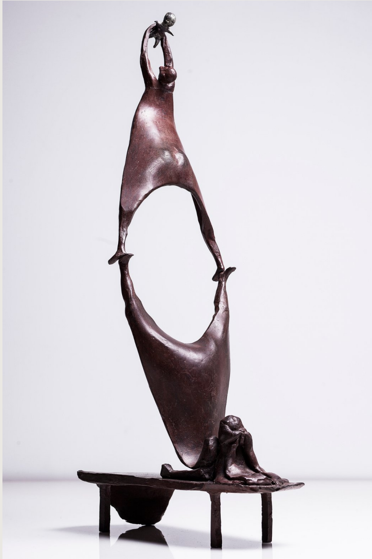
Alquimia. Bronce 54 x 30 x 15 cms. Autor: Francisco Armas Padrón.