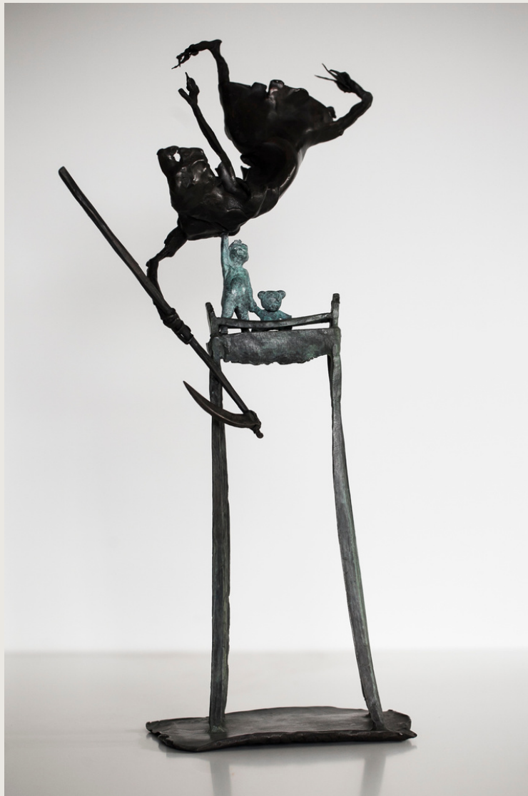
La inocencia vence a la muerte. Bronce 60 x 31 x 21 cms. Autor: Francisco Armas Padrón.

Durante la carrera de Bellas Artes me especialicé en Escultura porque para mí representaba un mundo por descubrir en el que podía expresar mis ideas y sentimientos de una manera más satisfactoria. Es el medio por el cual se da forma a un sentimiento, concepto, inquietud o idea. Considero todo un lujo poder modelar y fijar un pensamiento con las manos. Además, me atraían los materiales, la forma tridimensional y el movimiento. En el último curso descubrí el bronce y me cautivó por diversos motivos ”.