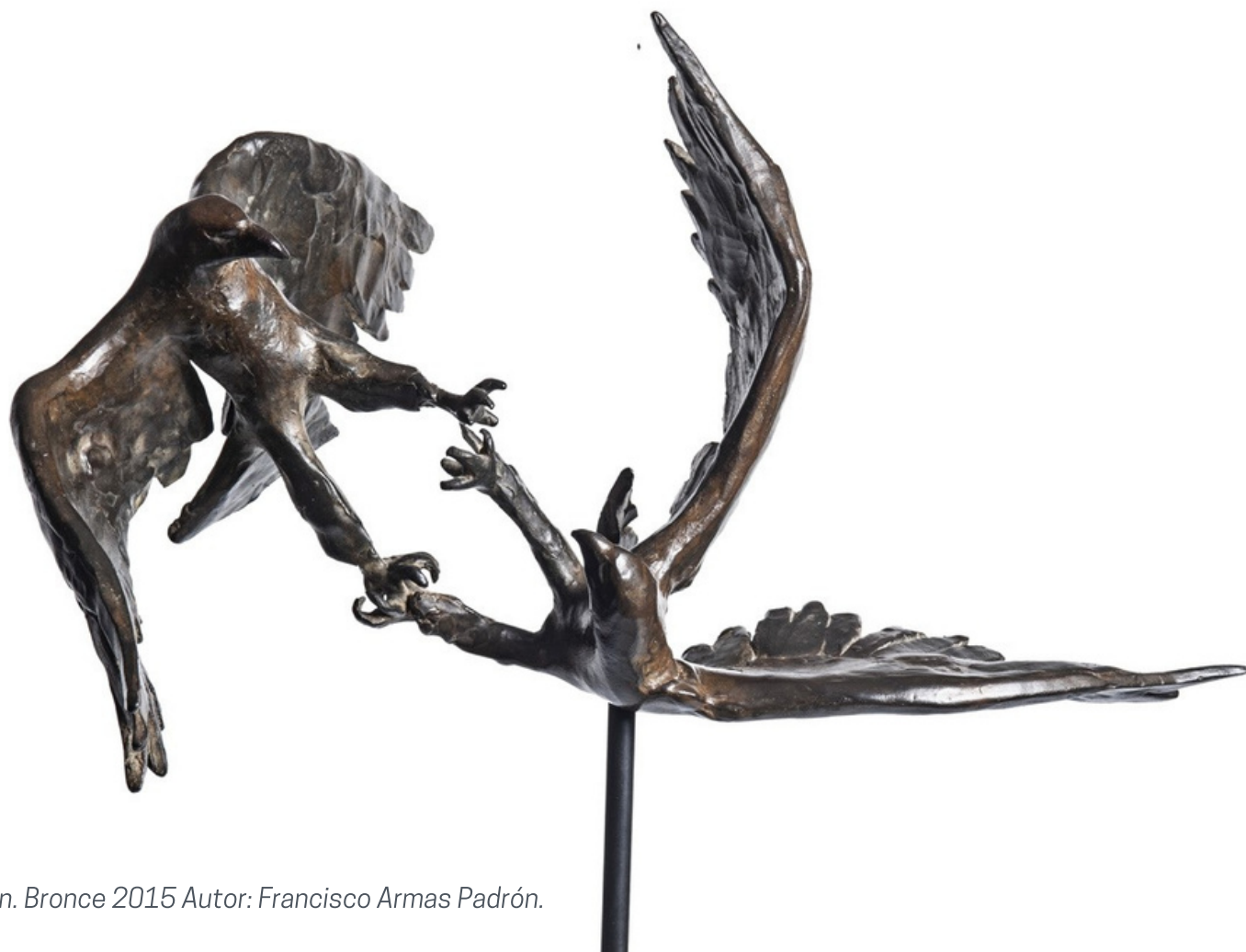
Unión. Bronce 2015 Autor: Francisco Armas Padrón.

Las esculturas que la componen son el intento de dar forma física a una serie de inquietudes y reflexiones sobre cómo la manera condicionada de mirarme a mí mismo y al mundo que me rodea, crea una “realidad” que puede no ser real. Se plantea que tal vez sea necesario cuestionar cada una de las creencias y conceptos que me han sido impuestas para, de alguna manera, despertar de esta especie de sueño.