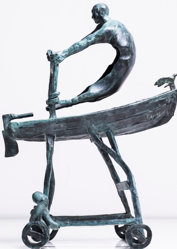
Llévame. Bronce 36 x 26 x 20 cms. Autor: Francisco Armas Padrón.

Desde 1998 hasta 2002 participó en diversas exposiciones colectivas e individuales en salas de arte y galerías de Tenerife, El Hierro, Vigo, Donostia y Vlieland (Holanda). Esta producción artística estaba inspirada por su amor por la literatura, por la música y por el cine, abarcando distintas técnicas gráficas (grafito, sepia, grabado, xilografía), pictóricas (acrílico y óleo) y escultóricas (resina de poliéster, bronce, piedra y cerámica).