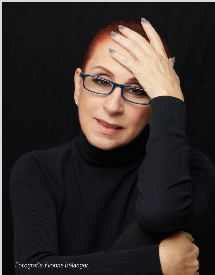
Fotografía Yvonne Bélanger.

TE INVITAMOS A SEGUIRLA EN SUS REDES SOCIALES