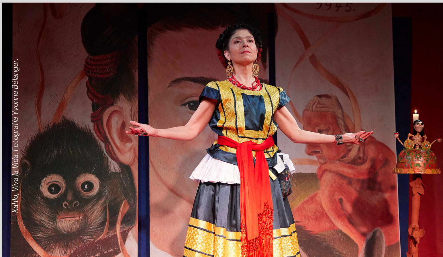
Kahlo, Viva la Vida.