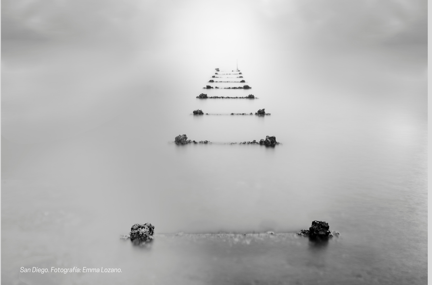
San Diego.