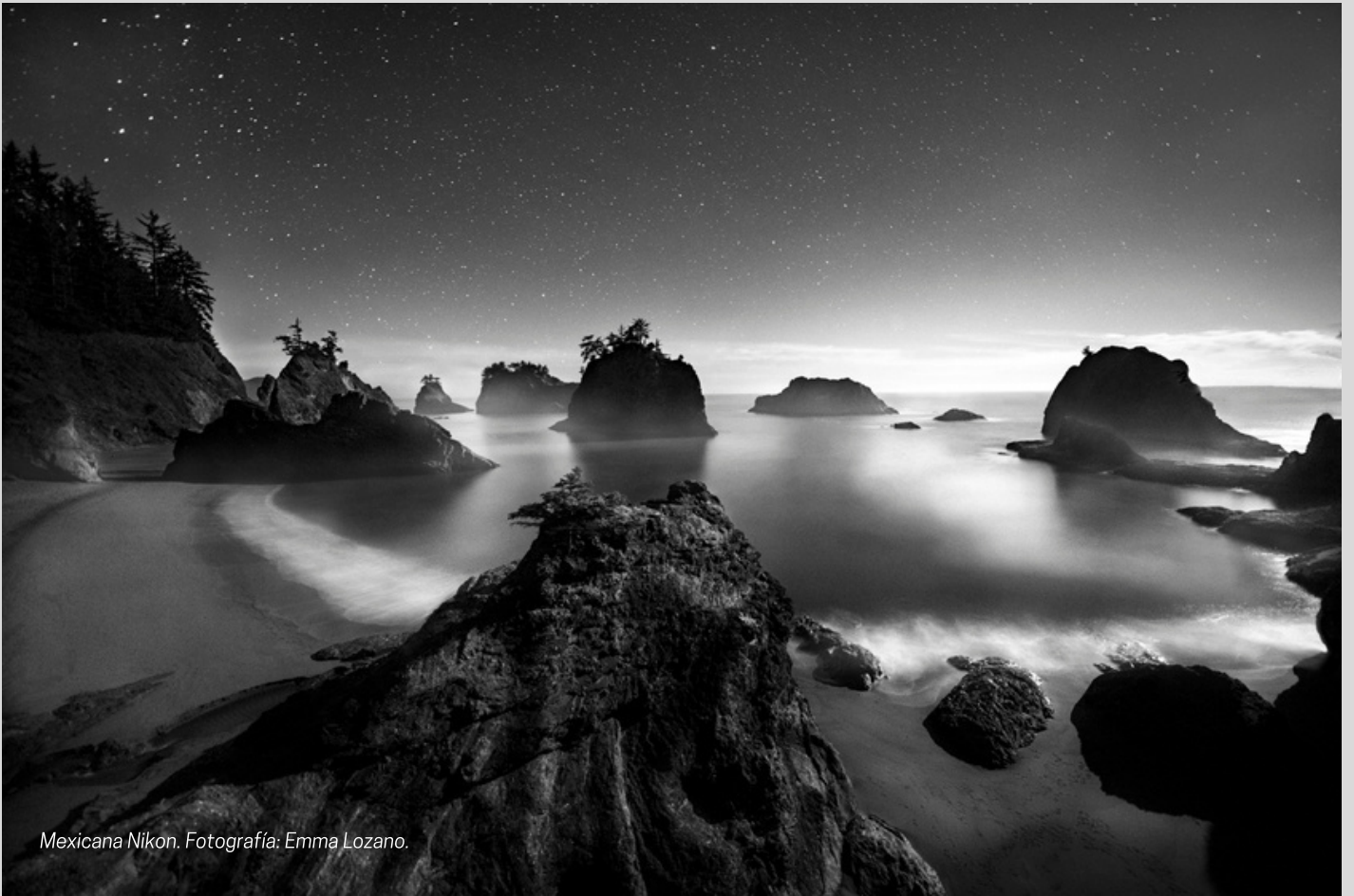
Mexicana Nikon.