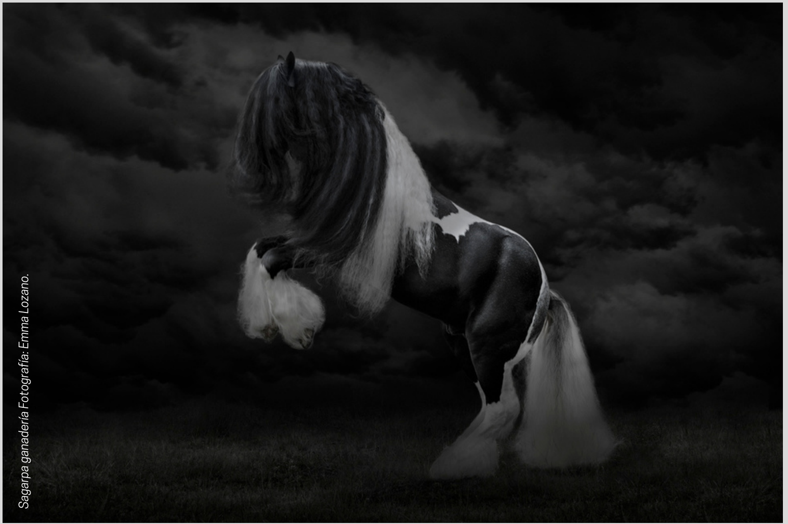
Sagarpa ganadería

Otras publicaciones que ha realizado han sido sobre la ganadería en México, con un estilo muy particular de capturar diversos ejemplares, pues no se limita a disparar su cámara, sino que busca la manera de interactuar con el ejemplar en cuestión, de manera que se logran trabajos extraordinarios, fuera de lo común. Otro campo que también ha realizado es la fotografía de producto.