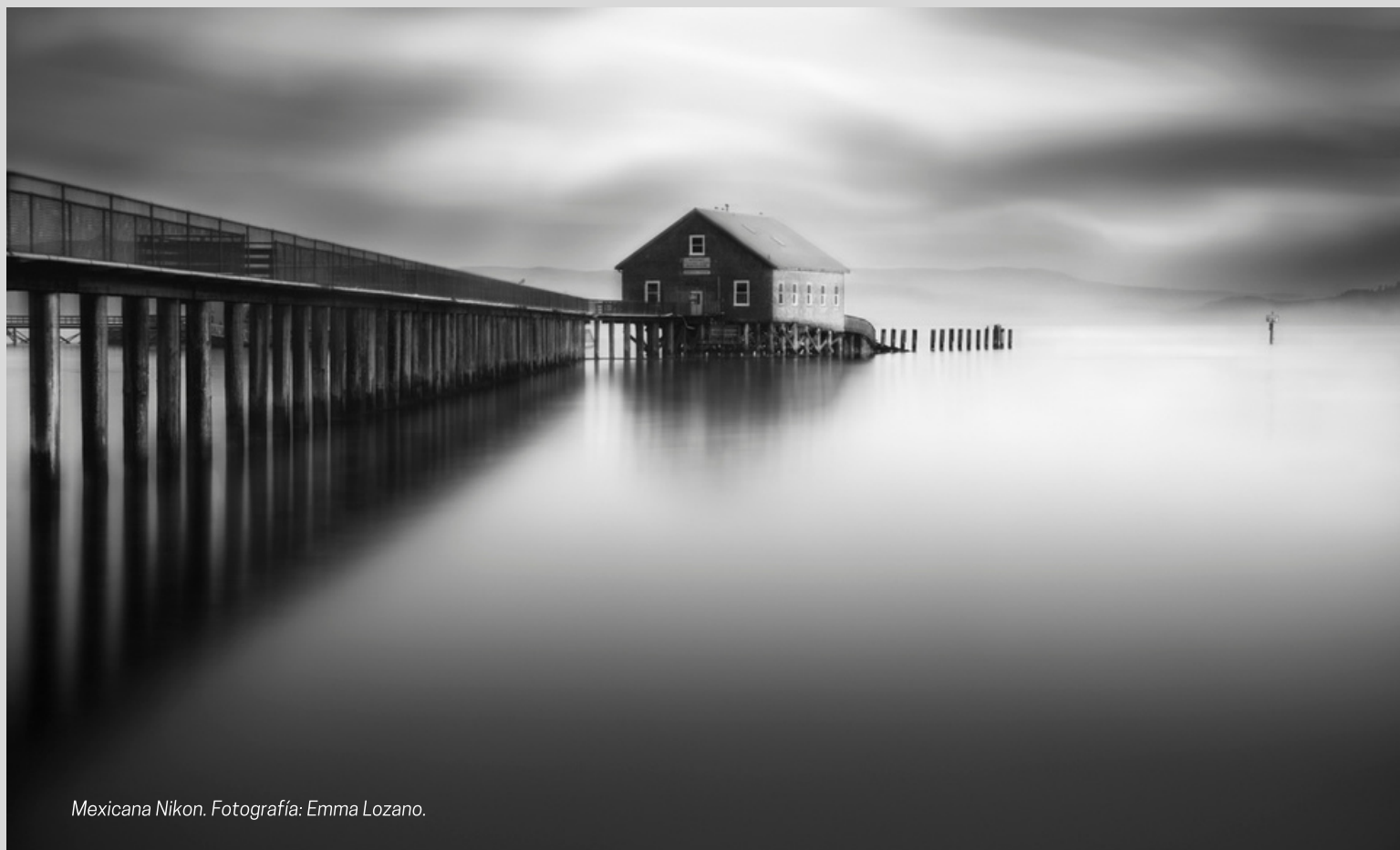
Mexicana Nikon.

El mundo visual y el sensorial han sido estímulos constantes en mi desarrollo profesional, especialmente cuando estoy en contacto con la naturaleza. Ya que como fotógrafa, cada imagen está inspirada en un momento distinto de la vida.