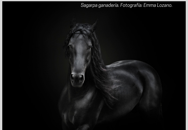
Sagarpa ganadería.