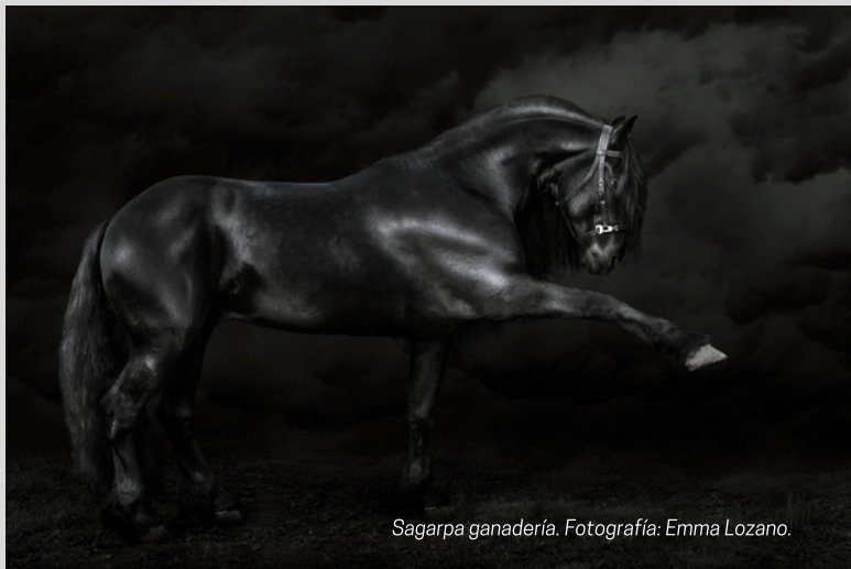
Sagarpa ganadería.

Otras publicaciones que ha realizado han sido sobre la ganadería en México, con un estilo muy particular de capturar diversos ejemplares, pues no se limita a disparar su cámara, sino que busca la manera de interactuar con el ejemplar en cuestión, de manera que se logran trabajos extraordinarios, fuera de lo común. Otro campo que también ha realizado es la fotografía de producto.