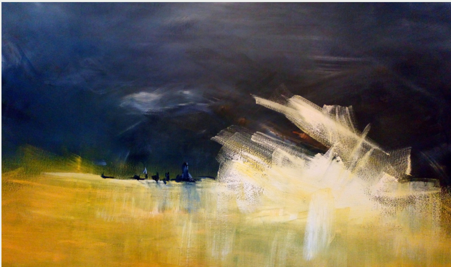
"Locación" de la serie paisajes del antropoceno, acrílico.

El Alto Valle es una extensa franja verde de 120 km poblada de frutales (peras, manzanas, duraznos entre otros) bordeada por agua y desierto . El paisaje se relaciona con el espacio que habito, lo inmediato, lo que me rodea, lo inabarcable de un paisaje abierto de horizonte infinito, pero a su vez íntimo. A través de la pintura recorro estos lugares conectando con la memoria y el presente de la tierra, las piedras y el agua.