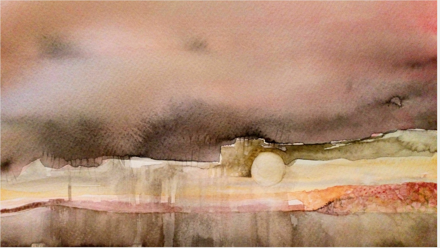
"Barda sur" de la serie paisajes del antropoceno, acuarela.

En mi praxis artística desde la pintura y la instalación como campo de acción y reflexión indago y experimento distintas formas de representación del paisaje contemporáneo en diálogo con el concepto de Antropoceno. (La era del mayor impacto del ser humano en la tierra).