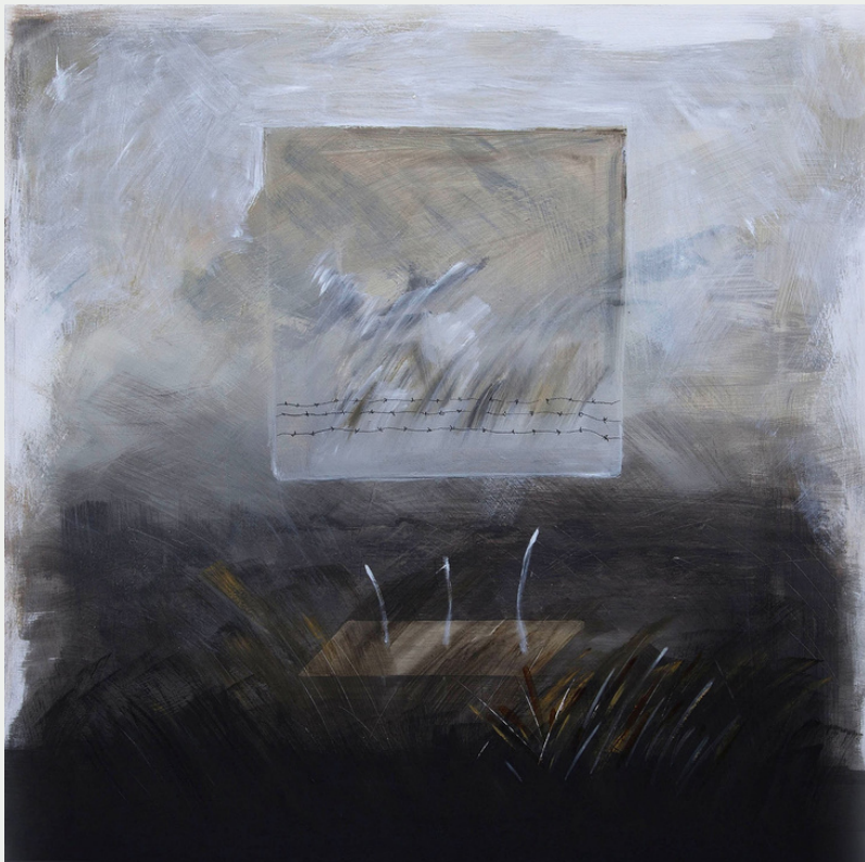
"Fragmento" de la serie paisajes del antropoceno, acrílico.