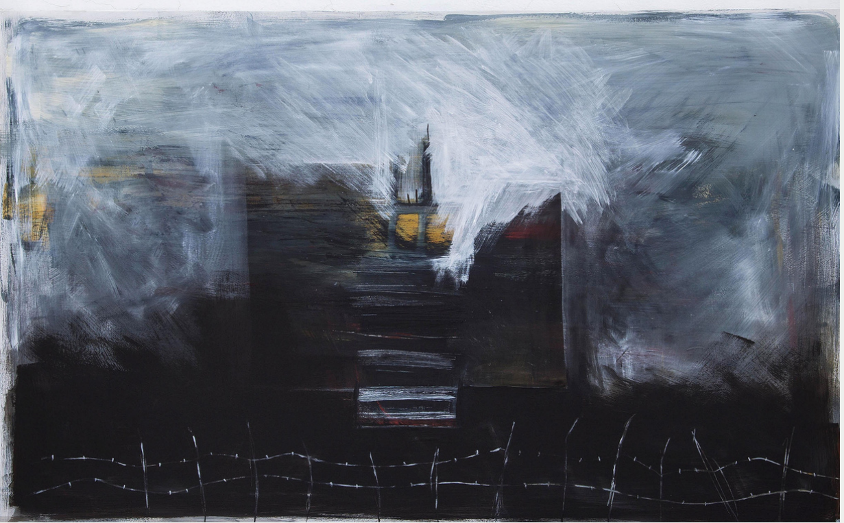
"Territorio" de la serie paisajes del antropoceno, acrílico.