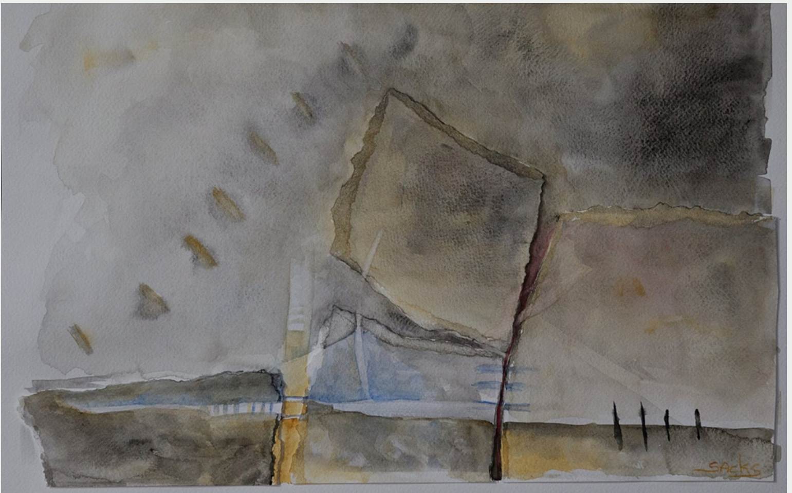
"Primigenio" de la serie paisajes del antropoceno, acuarela.