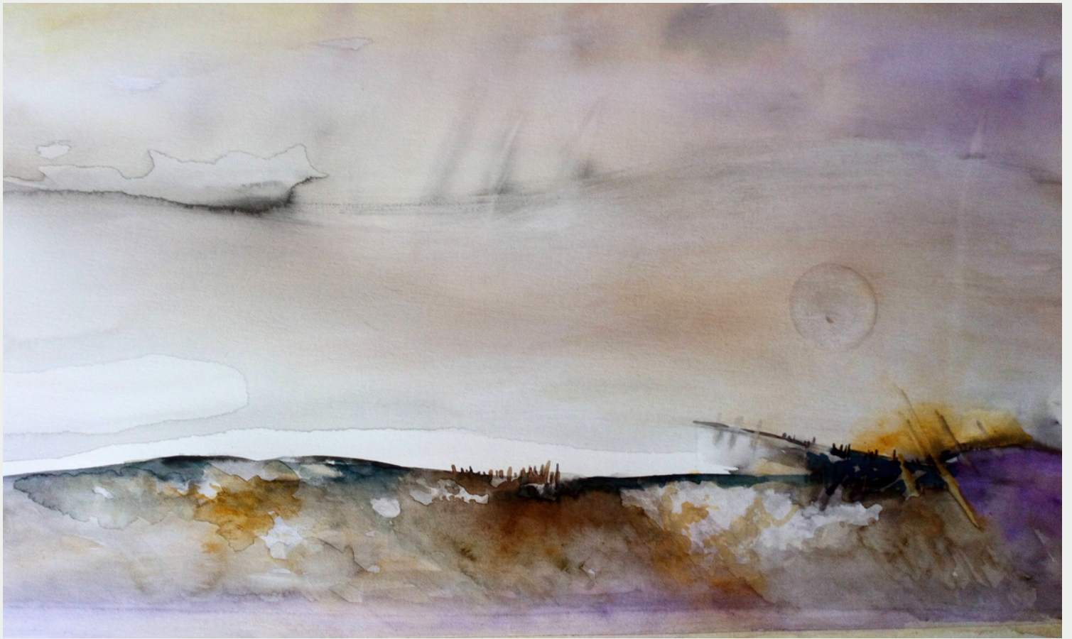
"Fiske" de la serie paisajes del antropoceno, acuarela.