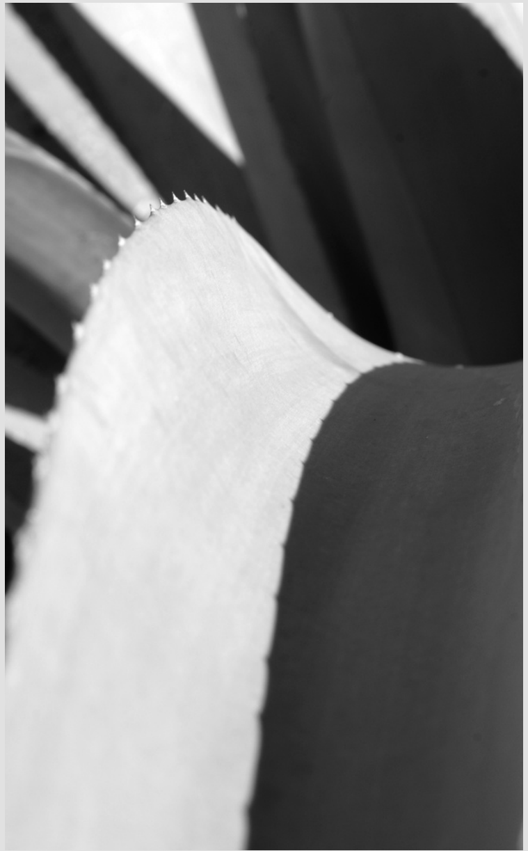
Bajo las sombras del tequila.

Con más de 20 años detrás de la lente y con 5 exposiciones colectivas y 15 exposiciones individuales actualmente radica entre la ciudad de Querétaro y la CDMX fotografiando arquitectura, publicidad, sociales, editorial, naturaleza, corporativa, deportiva, escénica, moda, aérea. Prepara su próxima exposición fotográfica intitulada “Deformación de la arquitectura a través de las líneas” la cual se presentará en cuanto termine la pandemia.