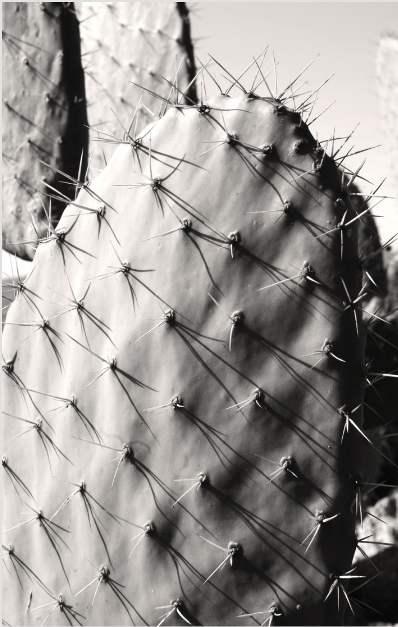
Nopales de Aculco.