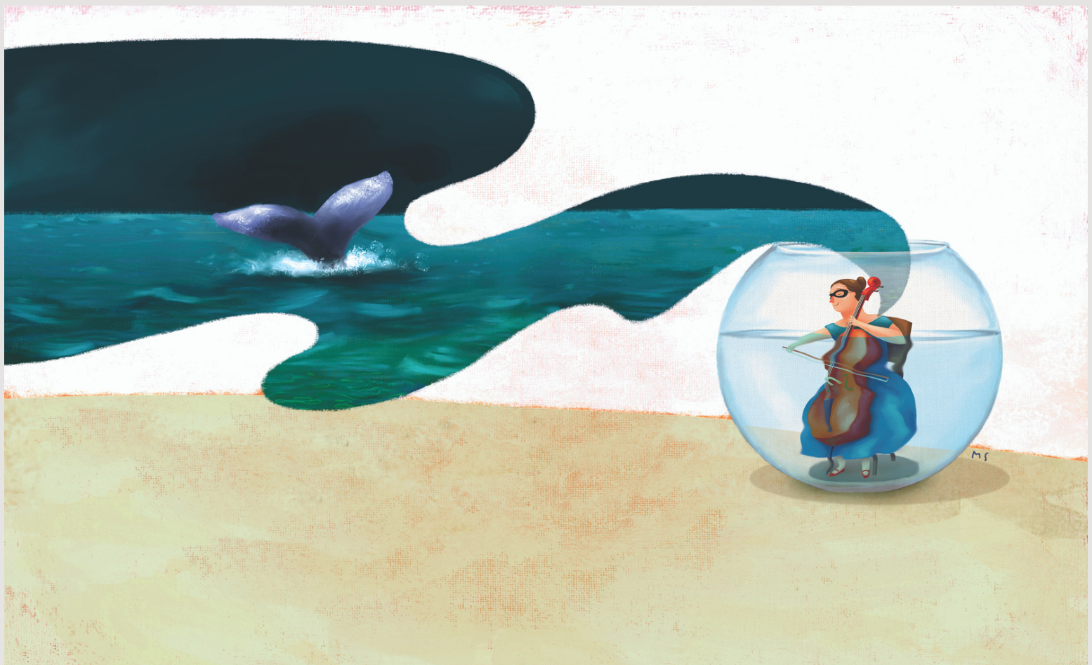
"El Agua". Ilustración de Margarita Sada.