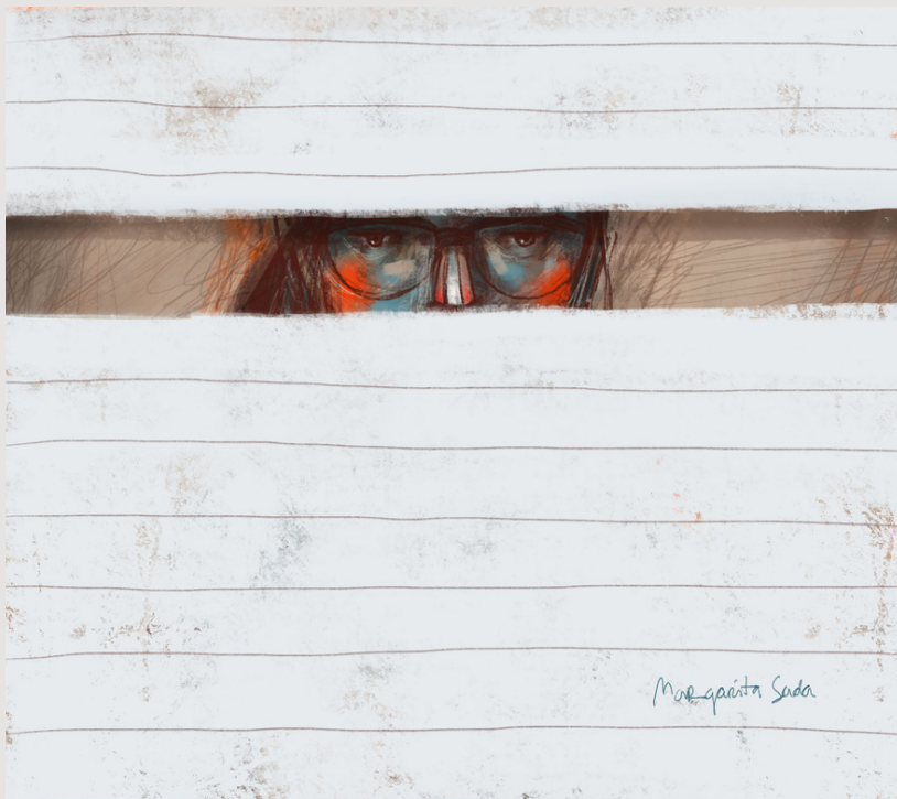
"Ventana de Papel" . Ilustración de Margarita Sada.

A partir de 2018 Margarita es integrante del Sistema Nacional de Creadores de Arte, FONCA con el proyecto de producción de su primer novela gráfica.