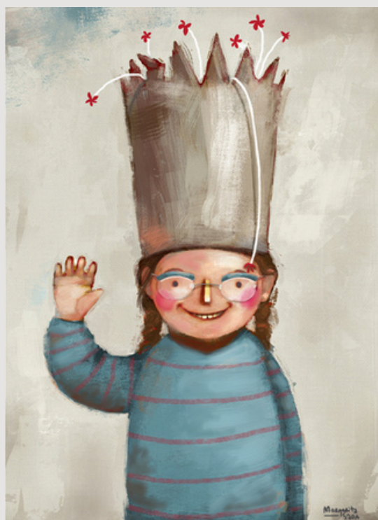
"Andrea Paula" . Ilustración de Margarita Sada.