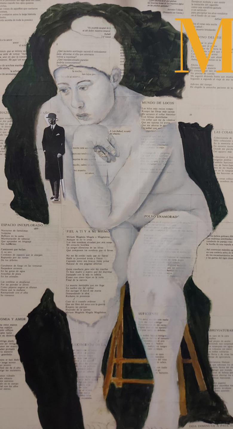
Obra de Marisa Armero

Siempre he tratado de plasmar en mi obras la complejidad, el poder y la riqueza espiritual de las mujeres. Mis mujeres son libres y tratan de estar siempre en lo más alto del pedestal, por ello a la vez son frágiles y fuertes.