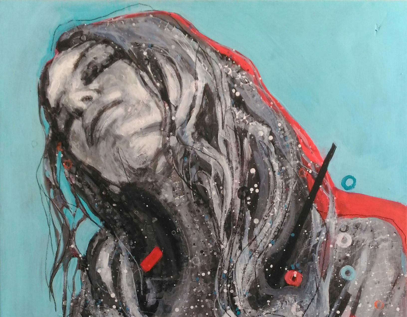
7 Acrílico sobre tabla de Patricia Caldevilla.

Y finalmente se ha conseguido crear una obra de arte si ese cuadro es capaz de seguir comunicándose con la persona que lo observa, si es capaz de provocar en el espectador también emociones. Emociones de muchos tipos, ya que cada espectador sentirá las suyas propias. Una obra puede tener miles de interpretaciones tantas como observadores y ahí se produce de nuevo la emoción y la magia del arte.