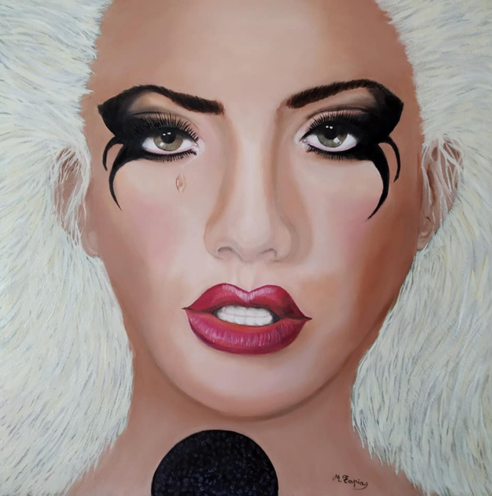
Vivir con Fibromialgia Lady Gaga. Pintura al óleo de Manoli Tapias.

La pintura como forma cambiante de captar el cambio.