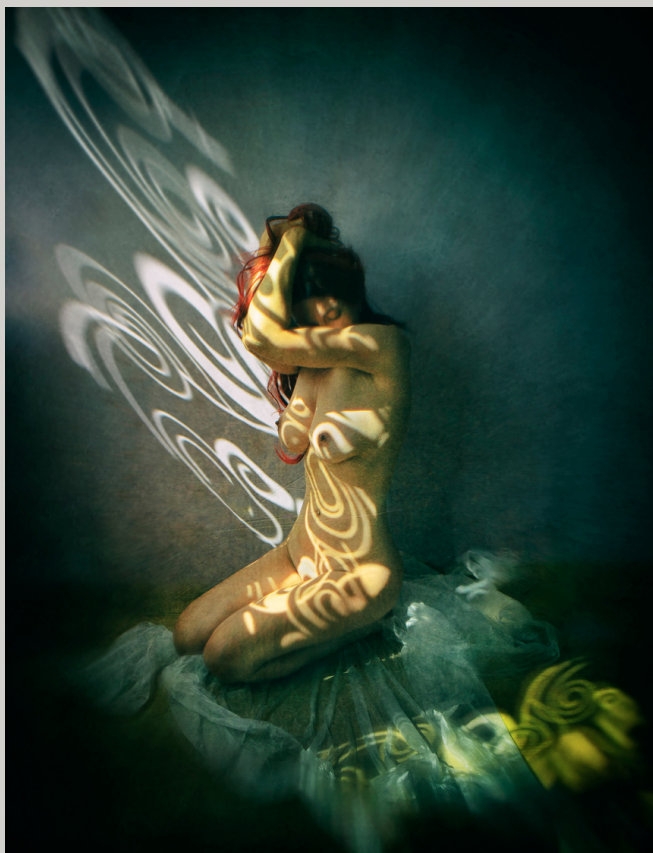
Vestirse de luz. Crissial.

El estilo propio se logra con el tiempo. Es útil estudiar el trabajo de grandes fotógrafos o artistas aunque lo más importante es encontrar quién realmente eres, qué te gusta y cómo expresarte con coherencia y continuidad a través de los recursos fotográficos.