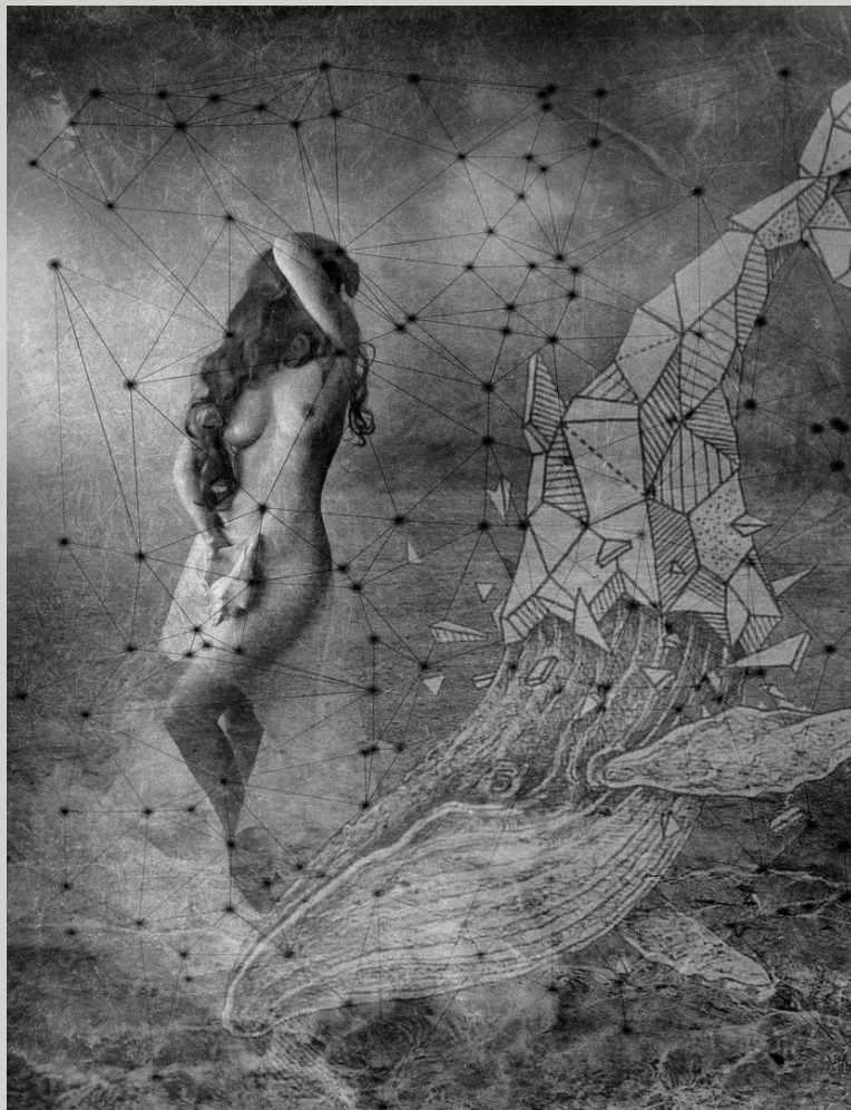
Soy de agua. Crissial.

Seguiré experimentando con nuevas técnicas mezclando la fotografía texturizada e intervenida tanto en edición como una vez impresa con pintura acrílica o diferentes materiales para resultados únicos y creativos que iré presentando en exposiciones y online.