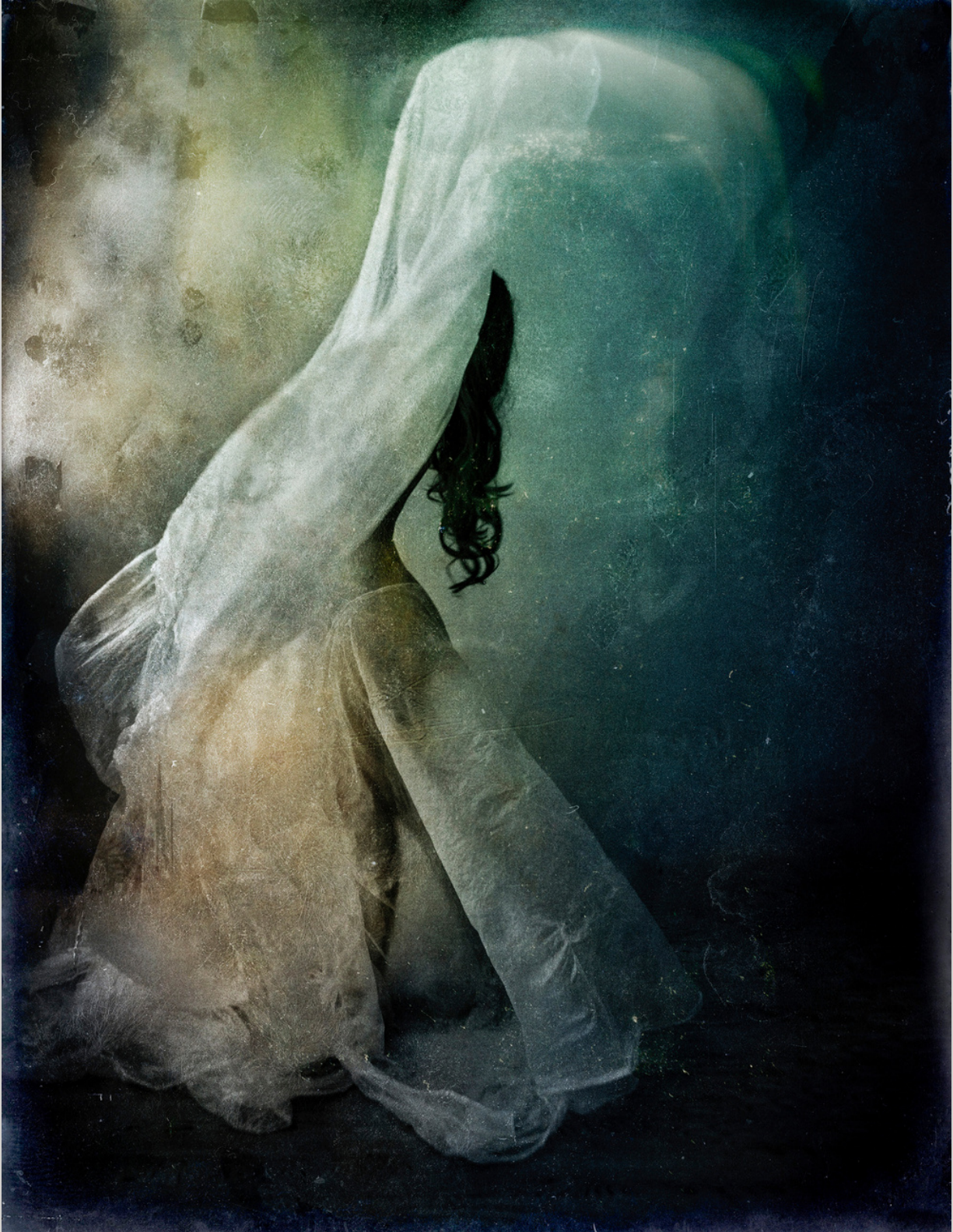
Un paso adelante. Crissial.

Crissial ha participado en múltiples exposiciones y ferias de arte a nivel nacional e internacional tanto colectivas e individuales. Aunque ha recibido varios premios y reconocimientos internacionales, según en la propia voz de la autora, su mayor logro ha sido ser capaz de transmitir emociones que despierten la conciencia.