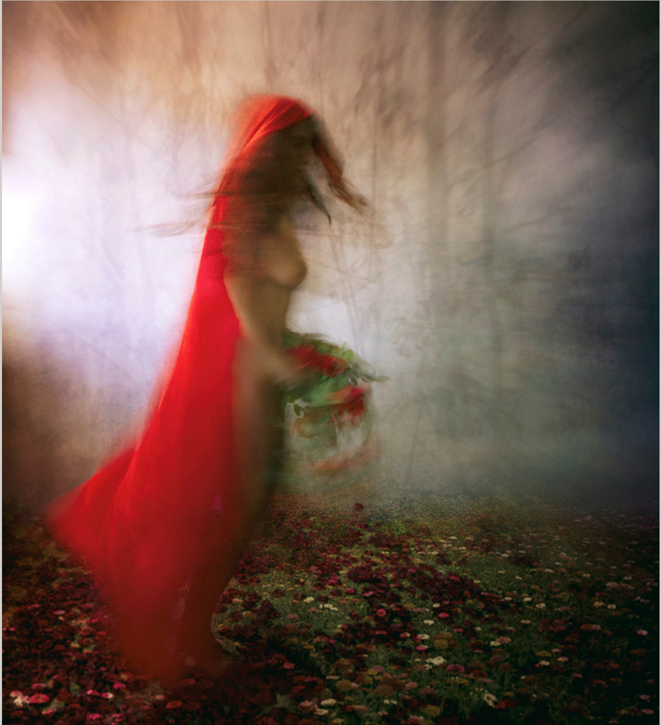
Red little hood. Crissial.

Como bien nos comenta ella, “es un continuo proceso de evolución y desarrollo de nuevas técnicas y experimentación mezclando, en última instancia, la fotografía texturizada e intervenida tanto desde la edición como en desde la impresa con pintura acrílica o diversos materias para conseguir así resultados únicos y creativos”.