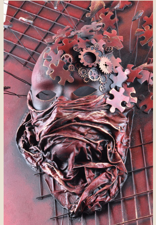
El silencio grita. Collage acrílico en 3D de Tania del Pozo.