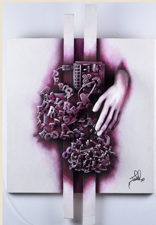
Los tres cerebros. Collage acrílico en 3D de Tania del Pozo.