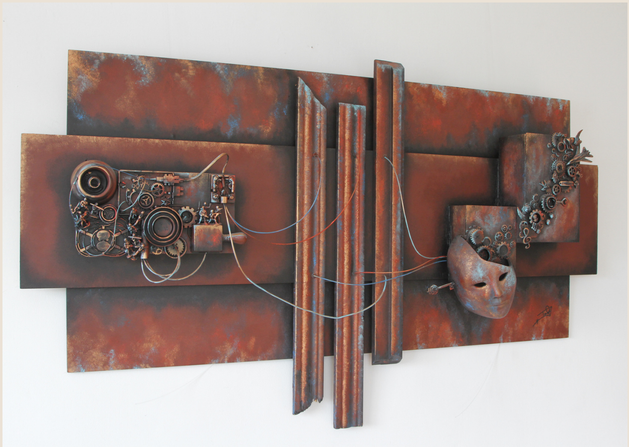
Condicionamientos y El Ser. Collage acrílico en 3D de Tania del Pozo.