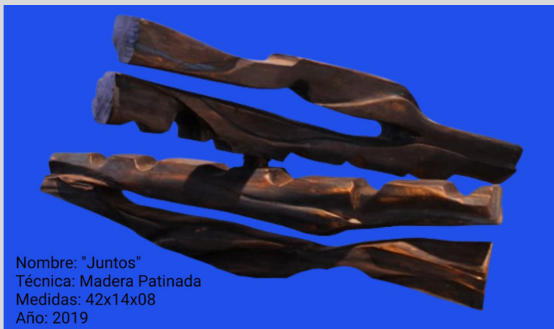
Nombre: "Juntos" Técnica: Madera Patinada Medidas: 42x14x08 Año: 2019

Nos provocan la introspección al vernos reflejados o identificados en las múltiples lecturas que nos ofrecen, a veces agrestes, a veces toscas, y en otras suaves y relajadas como la propia conducta de nuestros sentidos.