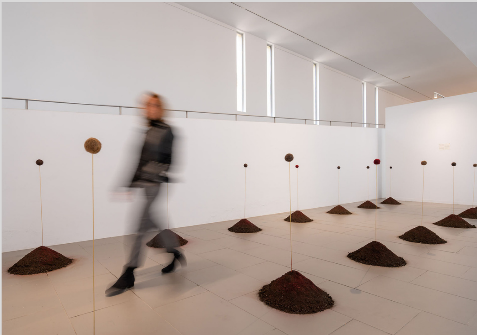
STILL LIVE II

Genus, premiada en el concurso Artesturak de Euskal Herria, plantea la cuestión de la identidad de género; mientras que la serie fotográfica Seis personajes en busca de autora, es un alegato contra el patriarcado. Asimismo, mi estética ha escrutado, en ocasiones, temas metafísicos como la muerte, en la instalación Ausencias-Presencias. Varias han sido las performances y los happenings de corte feminista contra la desigualdad salarial (Espai Can Batlló de Barcelona), la liberación de la mujer en el marco de la violencia (Jardines de los derechos humanos de Barcelona) o denuncia contra el patriarcado en la Casa de cultura de Hernani (Guipúzcoa), así como en Barcelona y Bilbao. En 2020 se produce la creación del binomio Generarte2020 a raíz del confinamiento, reflexionando acerca de la doble reclusión de la mujer maltratada.