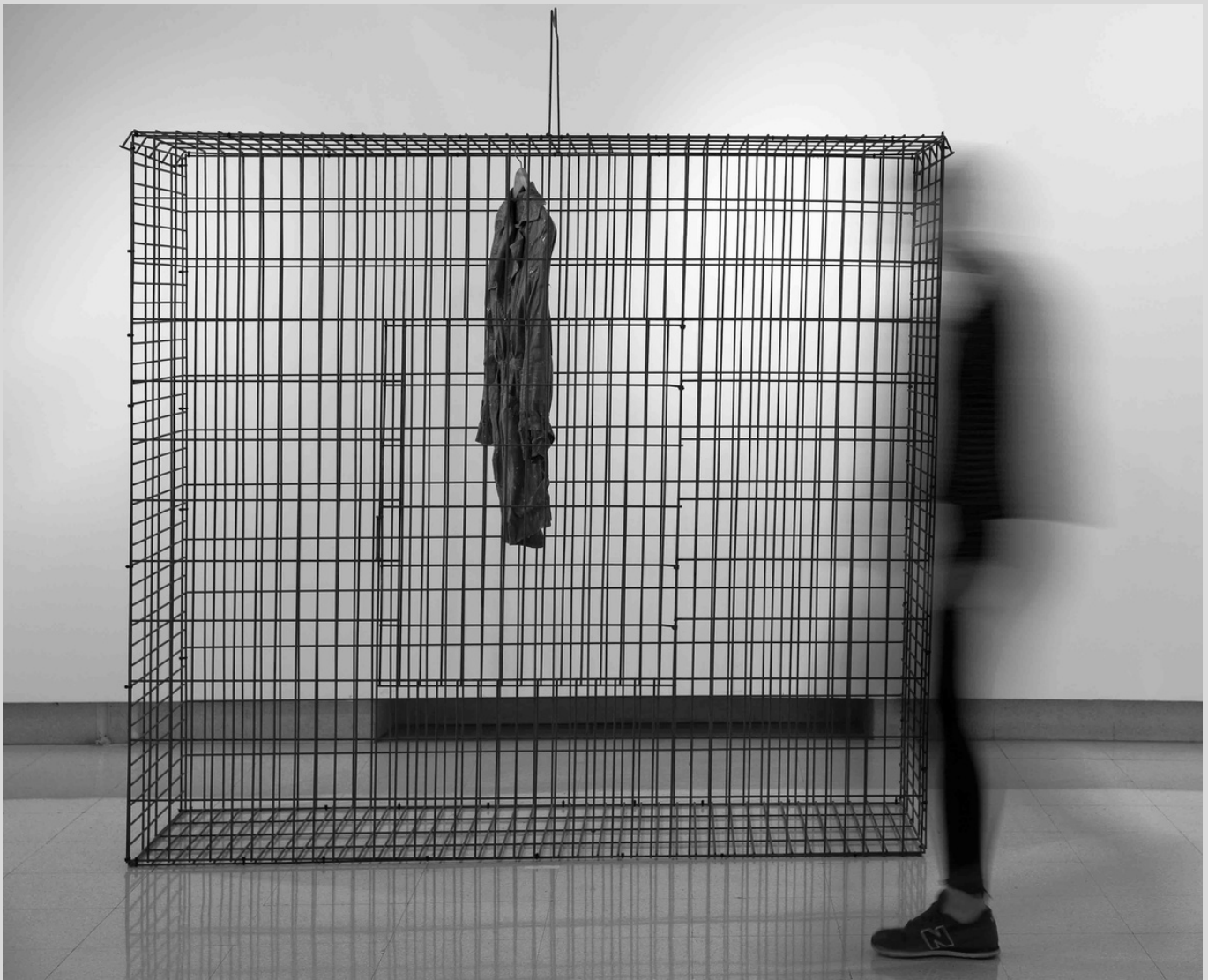
Gela 44. Es una particular mirada sobre el número de mujeres asesinadas por sus parejas exparejas en Euskal Herria durante el periodo 2007-2014.

En el 2021-22, hay que reseñar en primer lugar la instalación Still Live como denuncia de los feminicidios que ha recorrido varios espacios expositivos del País Vasco y ha sido comisariada por la Casa Amarilla durante la exposición en la sala de la Diputación de Málaga; se trata de un Memorial a las mujeres asesinadas en España durante el 2021; en segundo lugar un proyecto sobre Memoria histórica de género iniciado en Tabakalera, materializado en un mural realizado en acrílico y materias diversas como cabello y periódicos, titulado “Mujeres en la sombra”, y que junto a una exposición de documentos y objetos hace un recorrido itinerante por todo el País Vasco; asimismo, durante este período he realizado una exposición colectiva en el Museo Marco de Monterrey así como dos residencias artísticas, una en Tabakalera de San Sebastián y otra en la Hacería de Bilbao cuyo tema central ha sido la invisibilidad de la mujer y la violencia contra la misma.