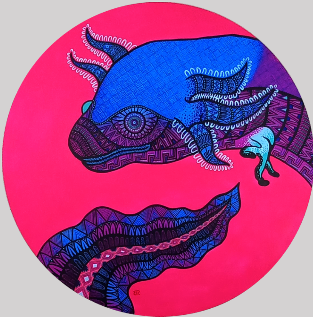
Axolotl. Medidas 1 mt diámetro. Técnica mixta: aerosol y acrílico sobre lienzo.

En 2020 estando lejos de México con mi familia, nos encontramos un estanque de Axolotes, a mis hijos les emocionó saber de este peculiar animalito pues no lo conocían, sobre todo estando lejos de su lugar de origen, mientras les contaba todas las historias que hay detrás de este particular anfibio comenzamos a hablar de los alebrijes, de su origen y lo que representan actualmente en la cultura mexicana, así se comienza a gestar señales, una colección de animales y seres de ficción llenos de colores y simbolismos zapotecas, mixtecas, mayas y aztecas, combinados con diseños geométricos modernos que representan la unión entre el pasado y el presente.