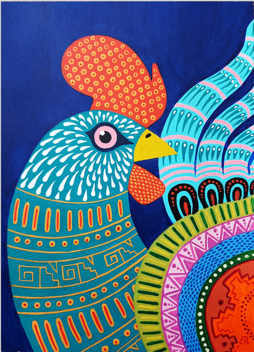
Gallo 20 x 28 cm Técnica mixta: aerosol y acrílico sobre mdf imprimado de 3 mm

Mis influencias son el Street art, superflat y el art toy, gracias a esto comencé a buscar y experimentar nuevas técnicas de colores en mis obras queriendo en ellas expresar la tremenda admiración por la cultura mexicana.