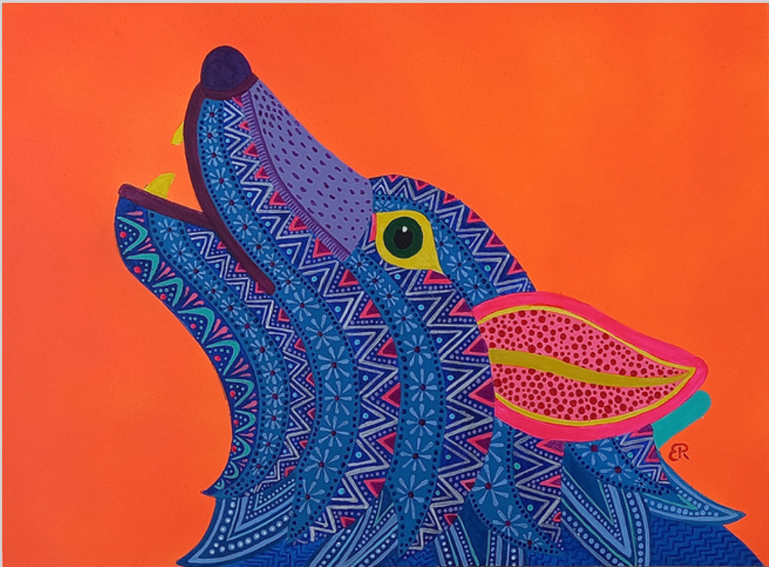
Lobo 20 x 28 cm Técnica mixta: aerosol y acrílico sobre mdf imprimado de 3 mm.

Esta colección se caracteriza por tener dos formatos, la pintura y el arte digital, este último se desarrolla en su totalidad en illustrator consiguiendo así exactitud y limpieza propios de la ilustración digital; impresos en papel fotográfico de alta calidad.