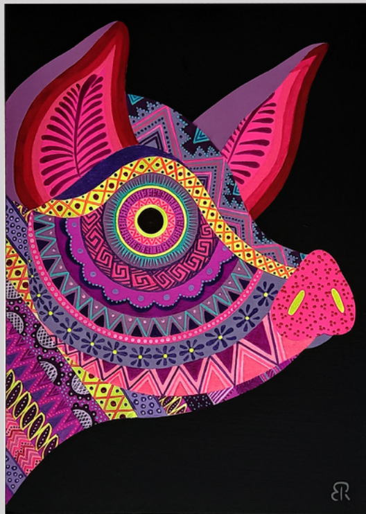
Bubbleymm 20 x 28 cm Técnica mixta: aerosol y acrílico sobre mdf imprimado de 3 mm.

Esta colección se caracteriza por tener dos formatos, la pintura y el arte digital, este último se desarrolla en su totalidad en illustrator consiguiendo así exactitud y limpieza propios de la ilustración digital; impresos en papel fotográfico de alta calidad.