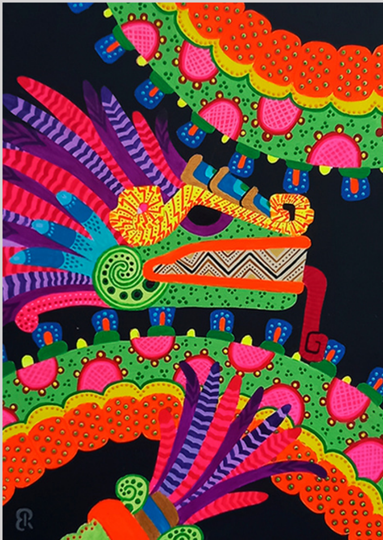
Quetzacoatl 20 x 28 cm Técnica mixta: aerosol y acrílico sobre mdf imprimado de 3 mm.